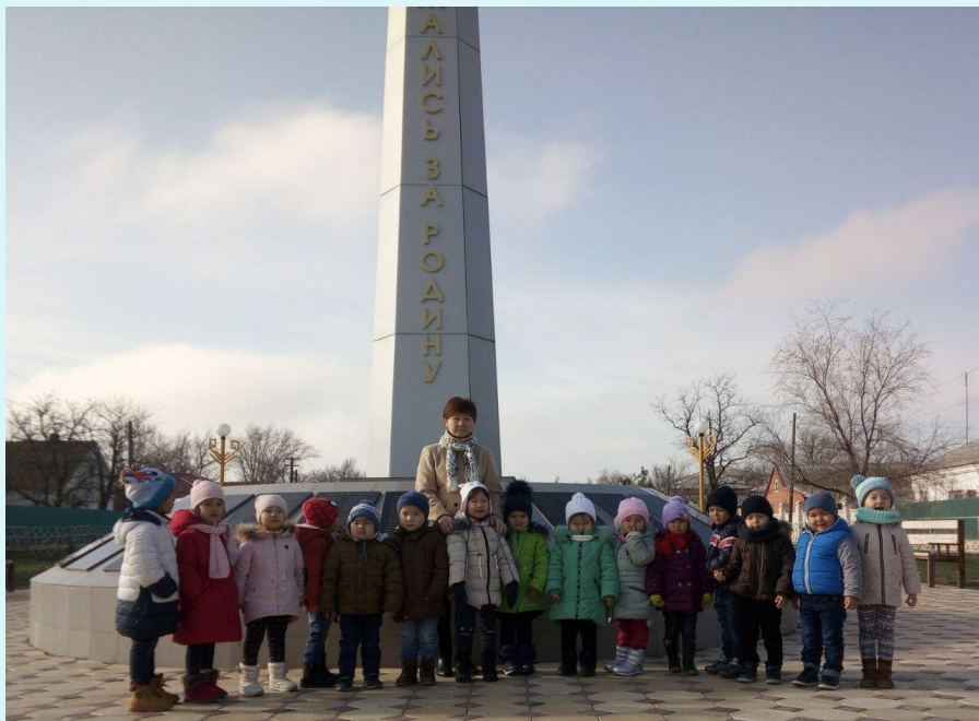
Комплекс вечного огня «Три солдата»