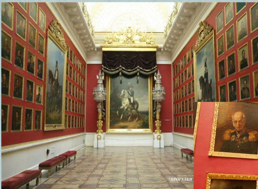
Государственная галерея Эрмитаж. Военная галерея 1812 года