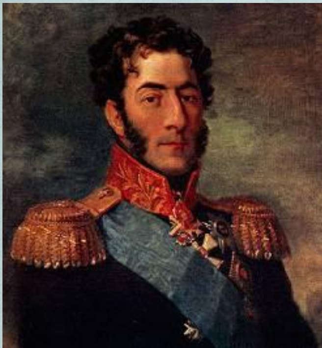
Командующий 2-ой Западной армией Багратион П. И.