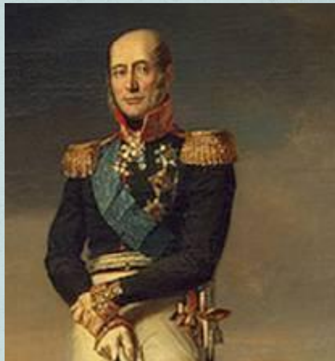
Командующий 1-ой Западной армией Барклай-де-Толли М. Б.