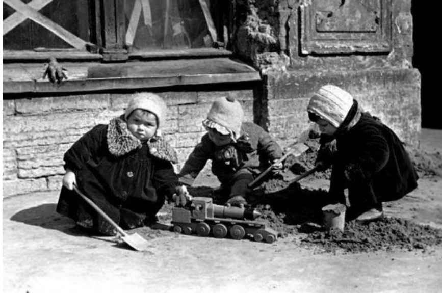
Дети играют на одной из улиц г. Ленинграда. 1942 год.