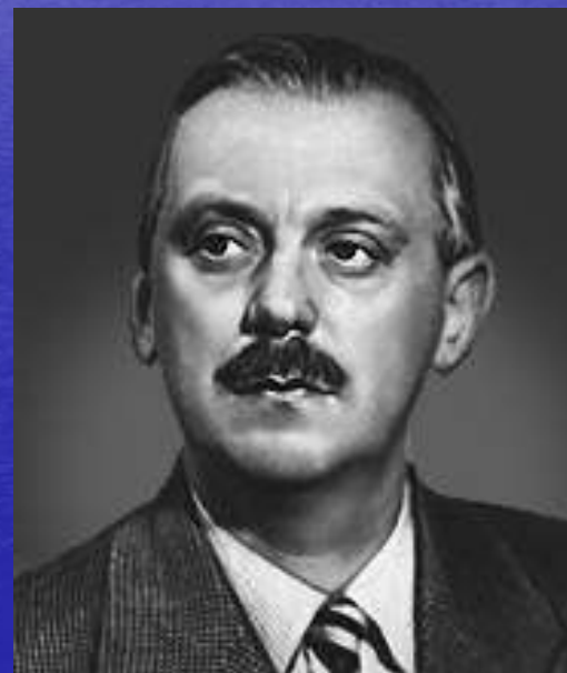
Михалков Сергей Владимирович