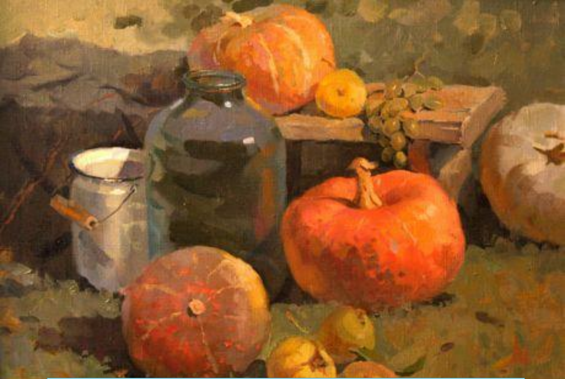
Дары Кубани. Прокопенко