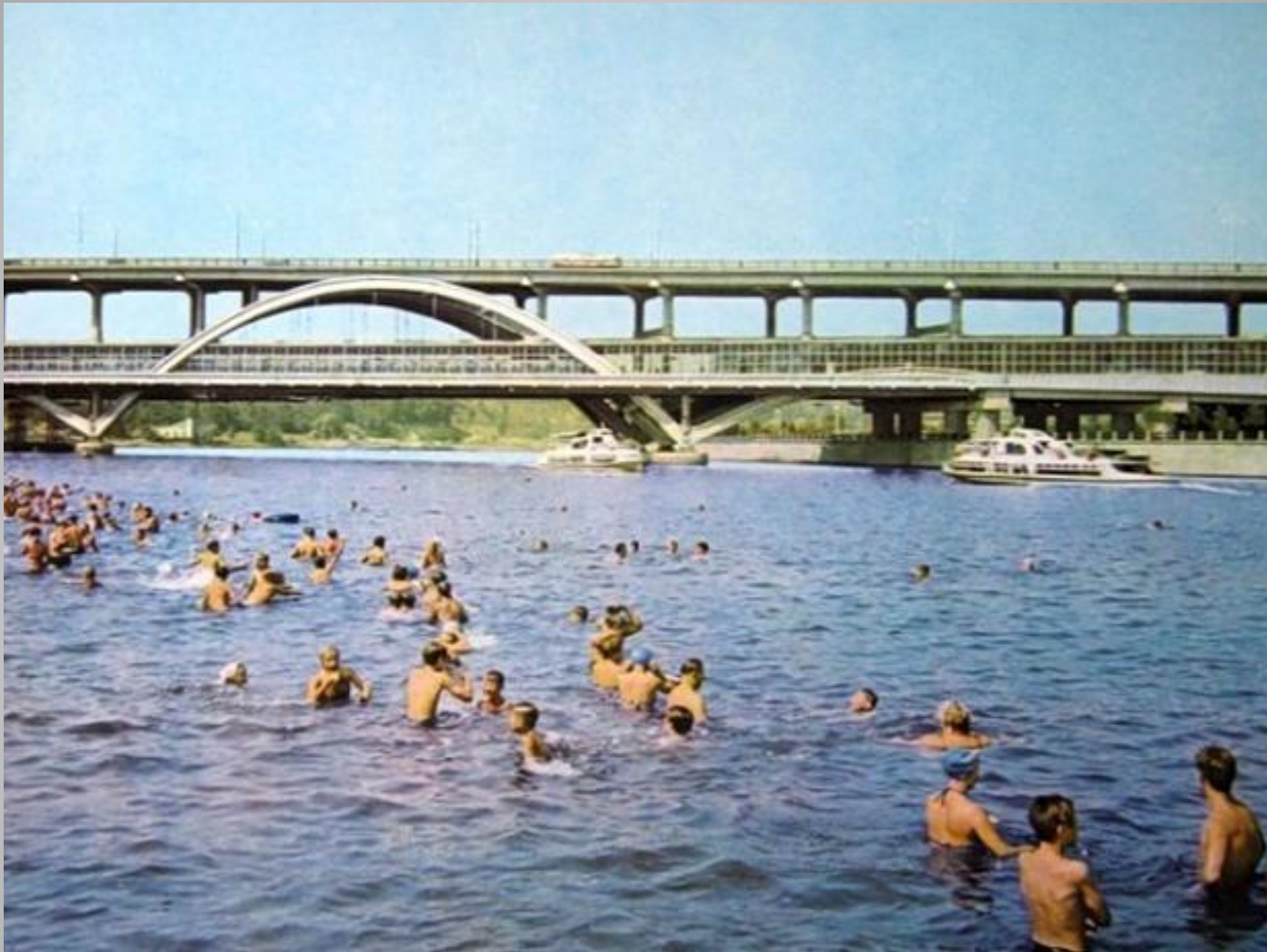
Купание в реке.