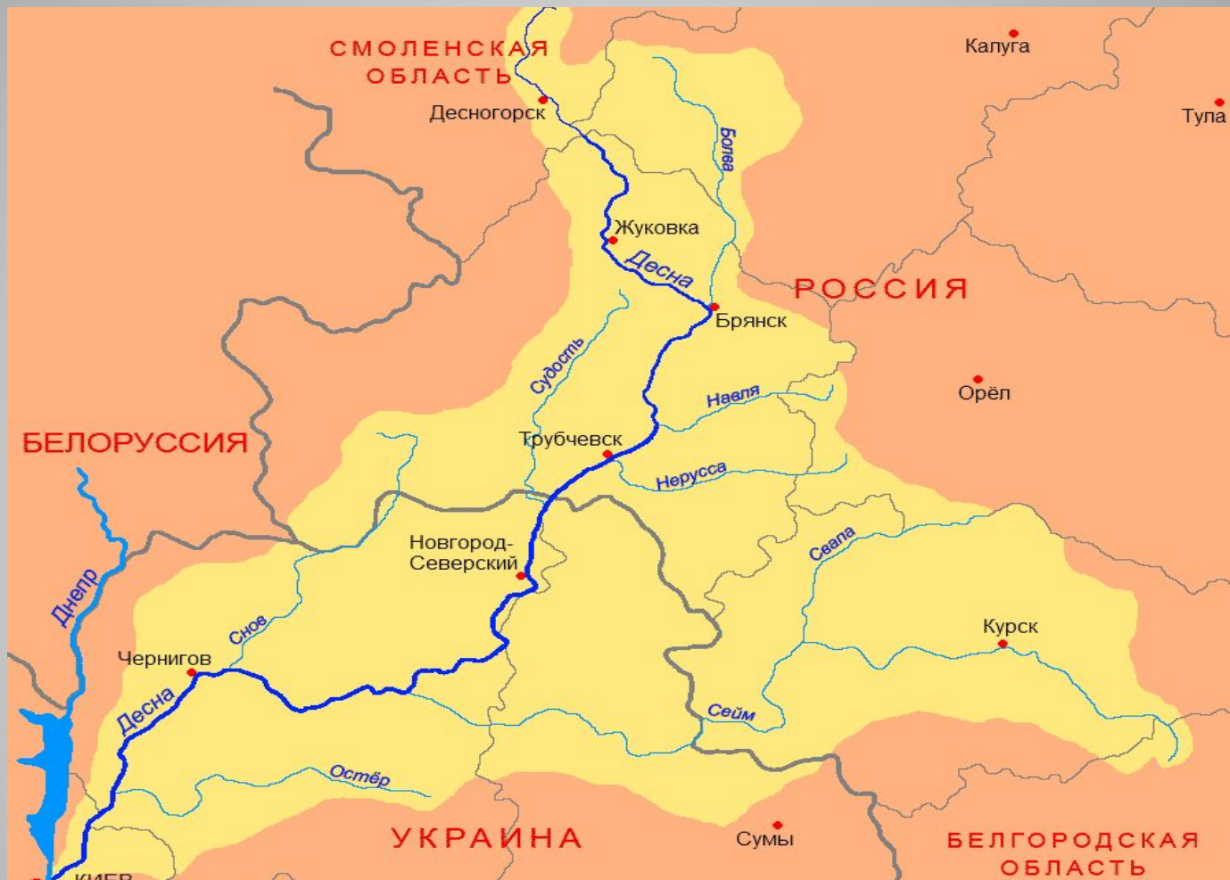
Карта бассейна реки Десны