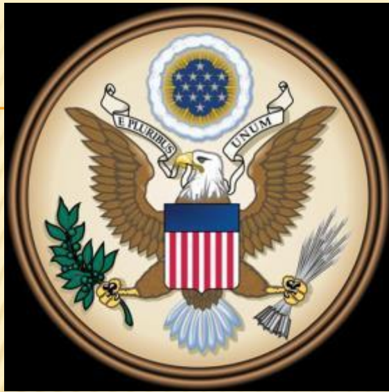
Соединённые Штаты Америки