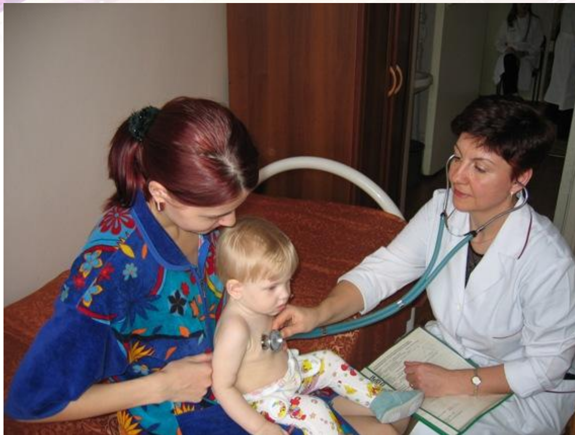
Педиатр – детский врач