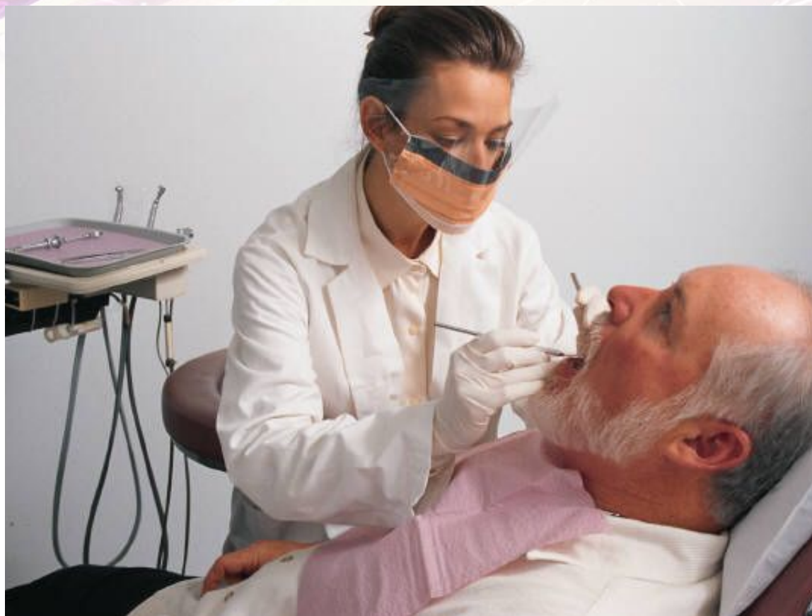
Стоматолог – зубной врач