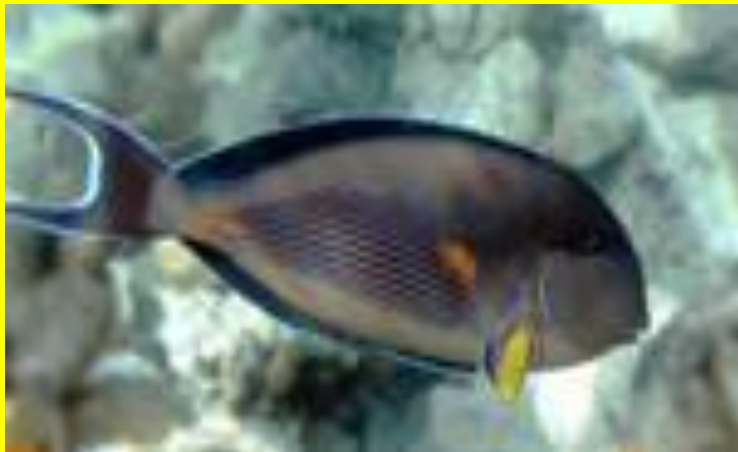
рыба - хирург