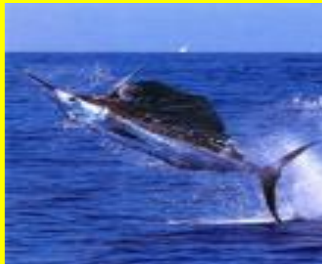
рыба - меч