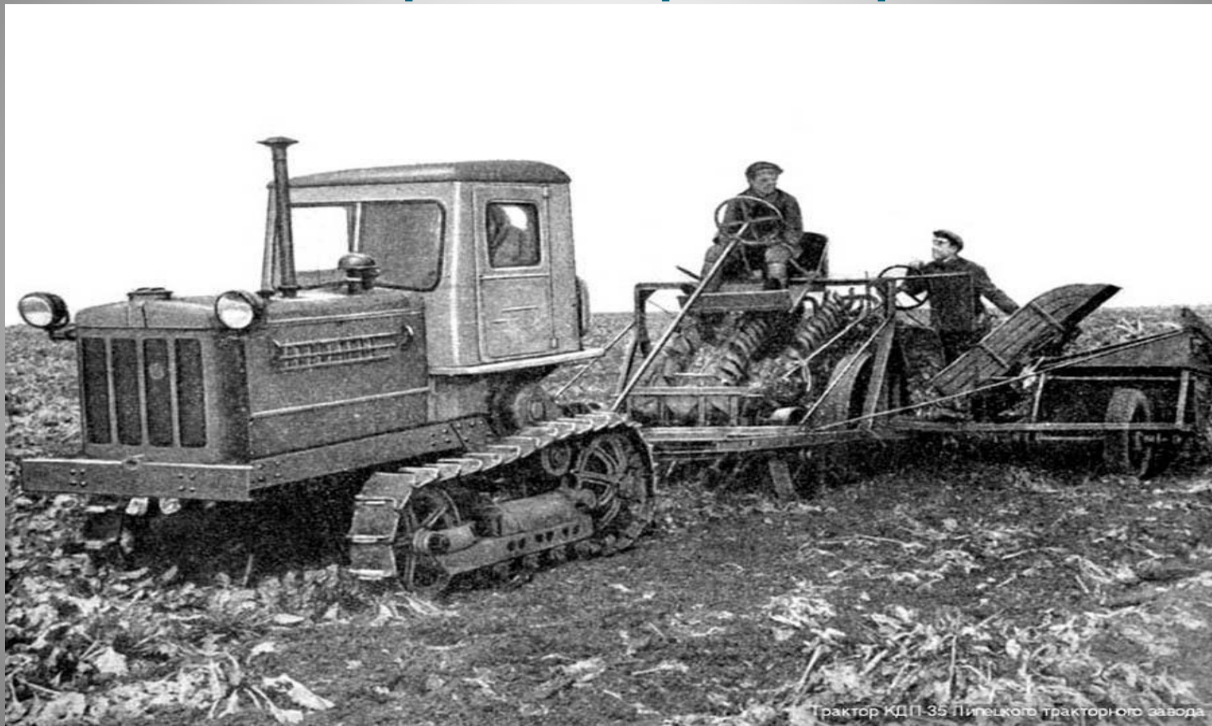
Трактор КДП-35 Пилецкого тракторного завода