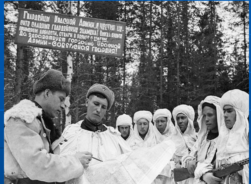
Разведчики получают боевое задание