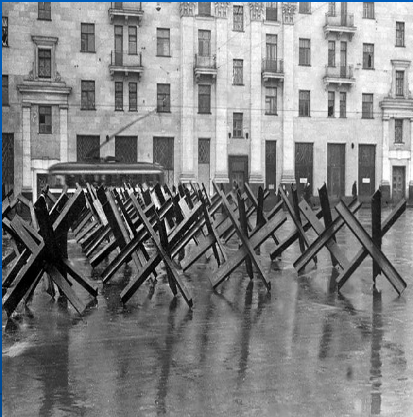
Противотанковые ежи на улицах Москвы