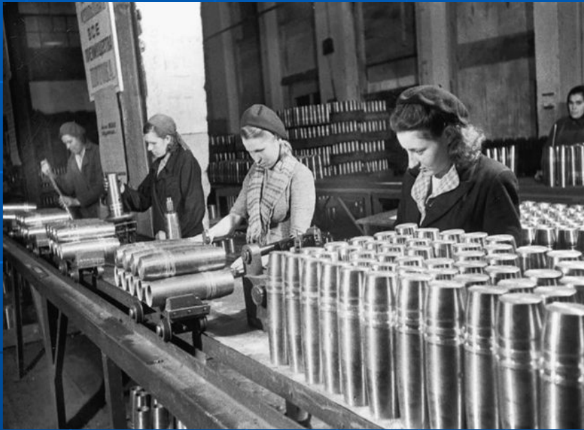
На артиллерийском заводе