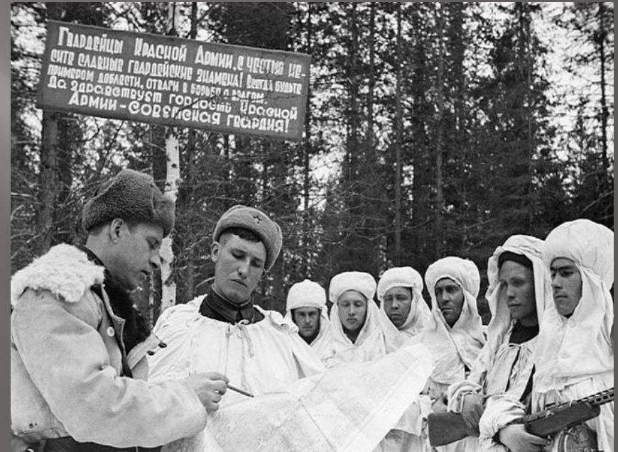
Разведчики получают боевое задание