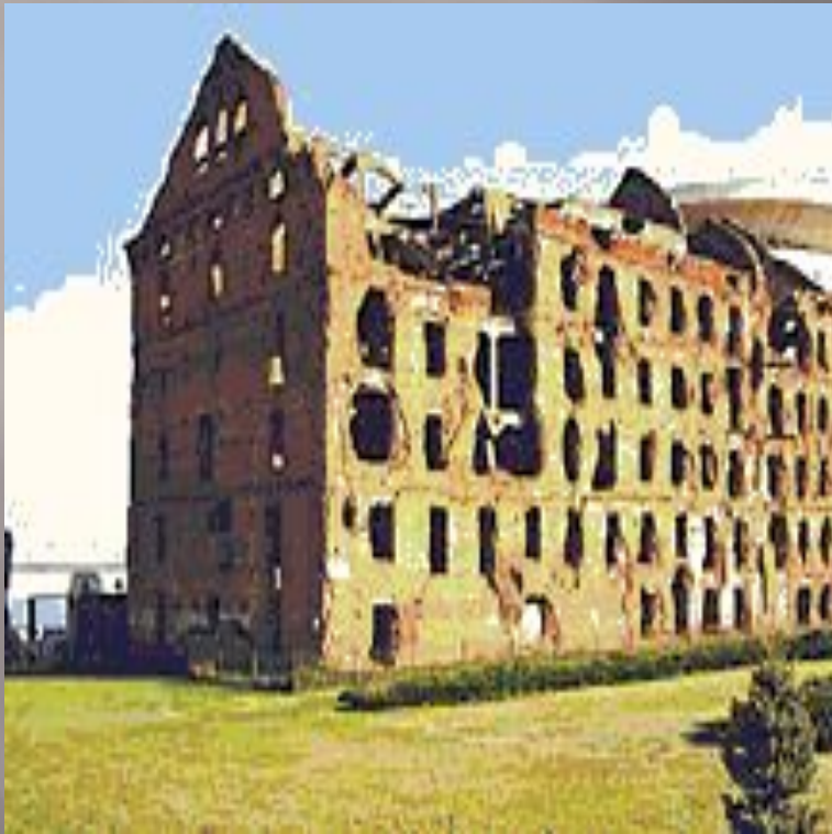
Волгоград. Дом Павлова.