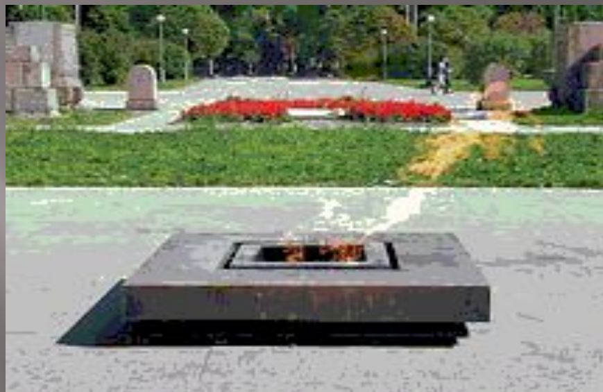
Вечный огонь на Марсовом поле. Санкт - Петербург.

В Москве у Кремлёвской стены горит вечный огонь – памятник погибшим воинам.