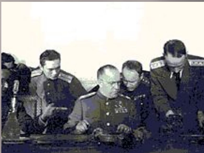
Г.К.Жуков подписывает Акт о безоговорочной капитуляции фашистской Германии. 9 мая 1945 года

Задохнулись канонады. В мире - тишина. На большой земле однажды Кончилась война. Будем жить, встречать рассветы, Верить и любить. Только не забыть бы это! Лишь бы не забыть! Эта память – верьте, люди, - всей земле нужна... Если мы войну забудем, Вновь придёт война.