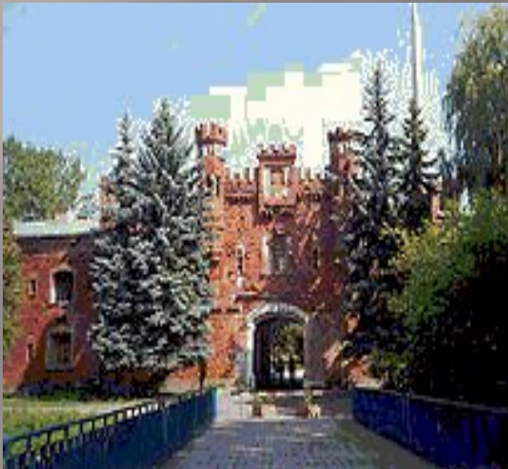
Брестская крепость. Холмский ворота.

БРЕСТСКАЯ КРЕПОСТЬ Первой приняла бой с фашистами пограничная Брестская крепость. В ней жил гарнизон – бойцы с семьями. В то утро погибло сотни бойцов, женщин детей. Немцы захватили её.