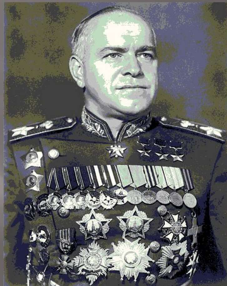
Трижды герой Советского Союза Георгий Константинович Жуков.