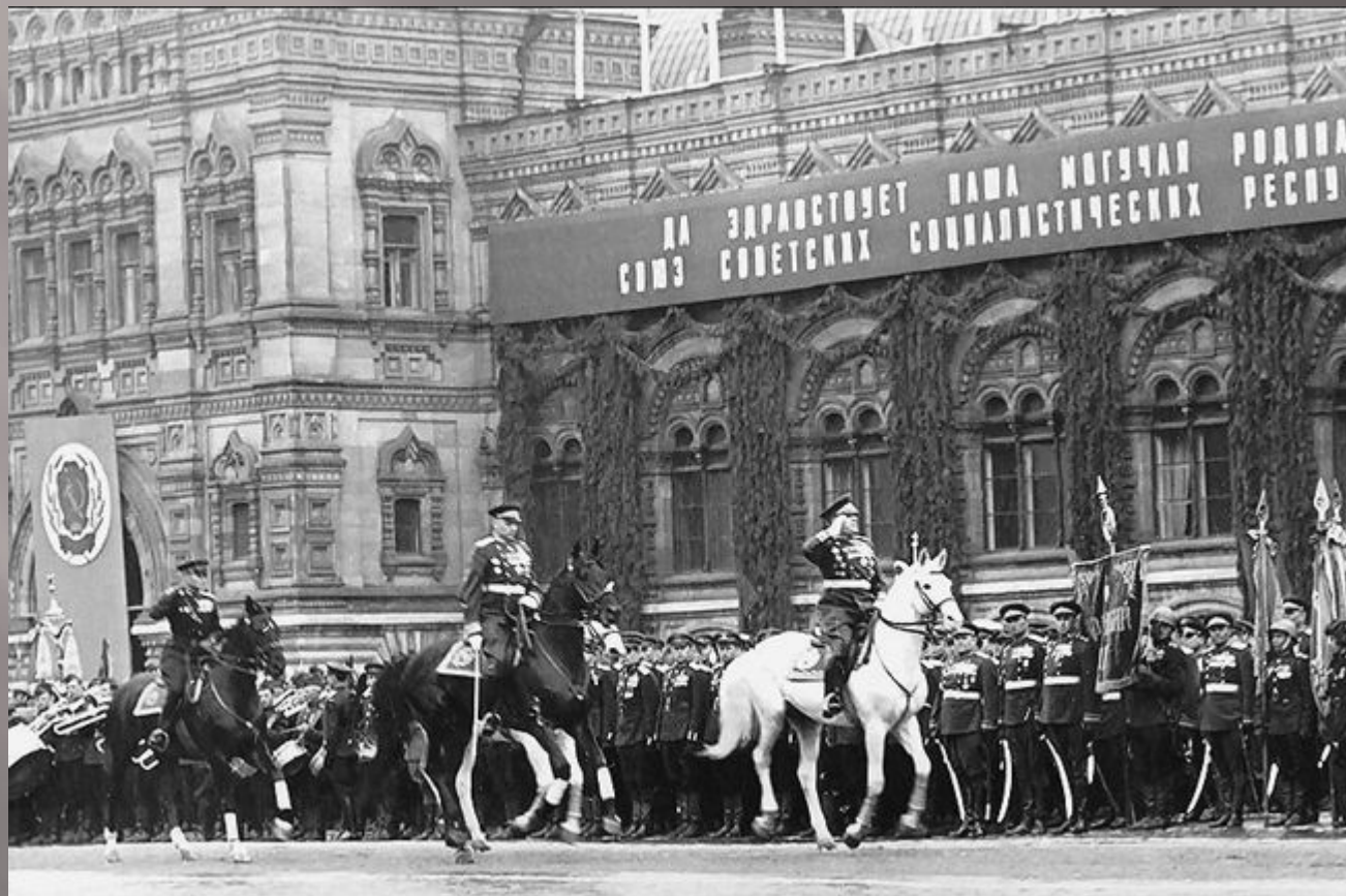
Парад Победы. Маршалы Советского Союза Г.К.Жуков и Г.К. Рокоссовский. 24 июня 1945 года. Красная площадь.