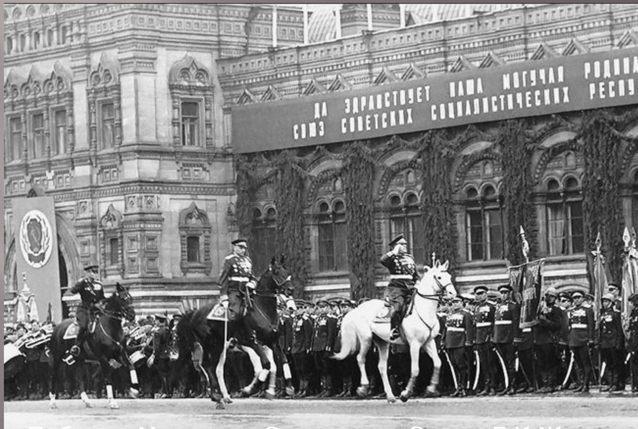
Парад Победы. Маршалы Советского Союза Г.К.Жуков и Г.К. Рокоссовский. 24 июня 1945 года. Красная площадь.