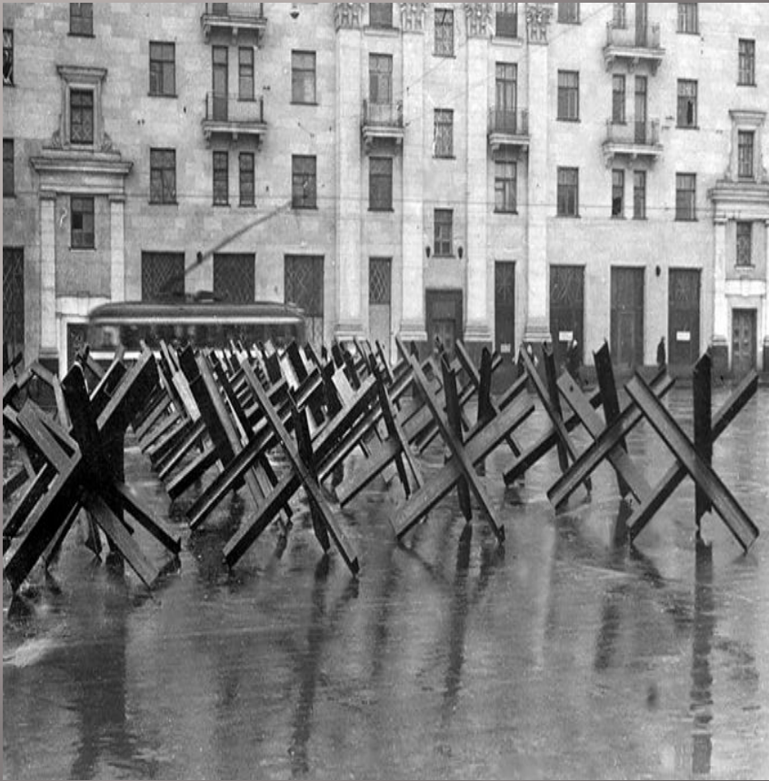
Противотанковые ежи на улицах Москвы