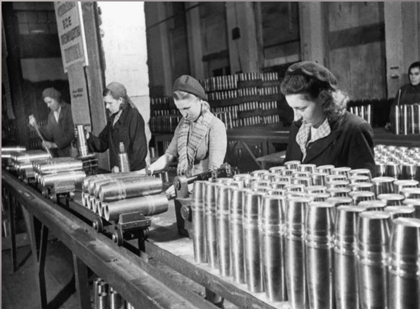
На артиллерийском заводе