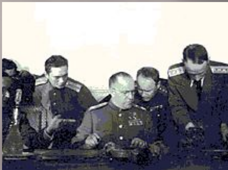
Г.К.Жуков подписывает Акт о безоговорочной капитуляции фашистской Германии. 9 мая 1945 года

Задохнулись канонады. В мире - тишина. На большой земле однажды Кончилась война. Будем жить, встречать рассветы, Верить и любить. Только не забыть бы это! Лишь бы не забыть! Эта память – верьте, люди, - всей земле нужна... Если мы войну забудем, Вновь придёт война.