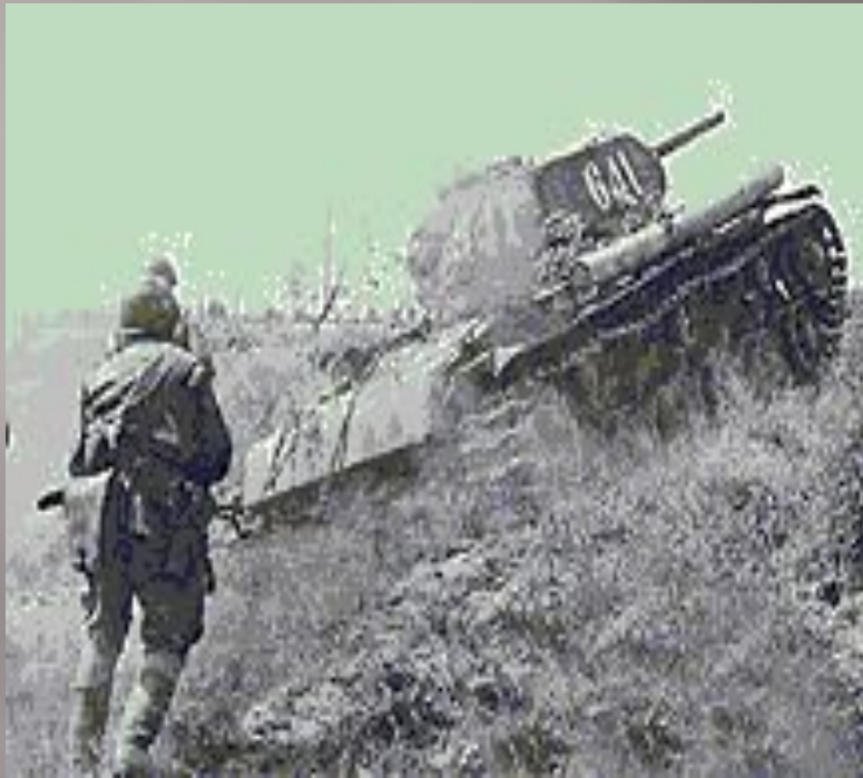
Курская битва. Пехота идёт в атаку под прикрытием танков