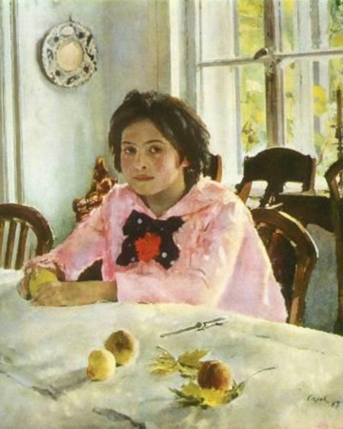
Серов «Девочка с персиками»