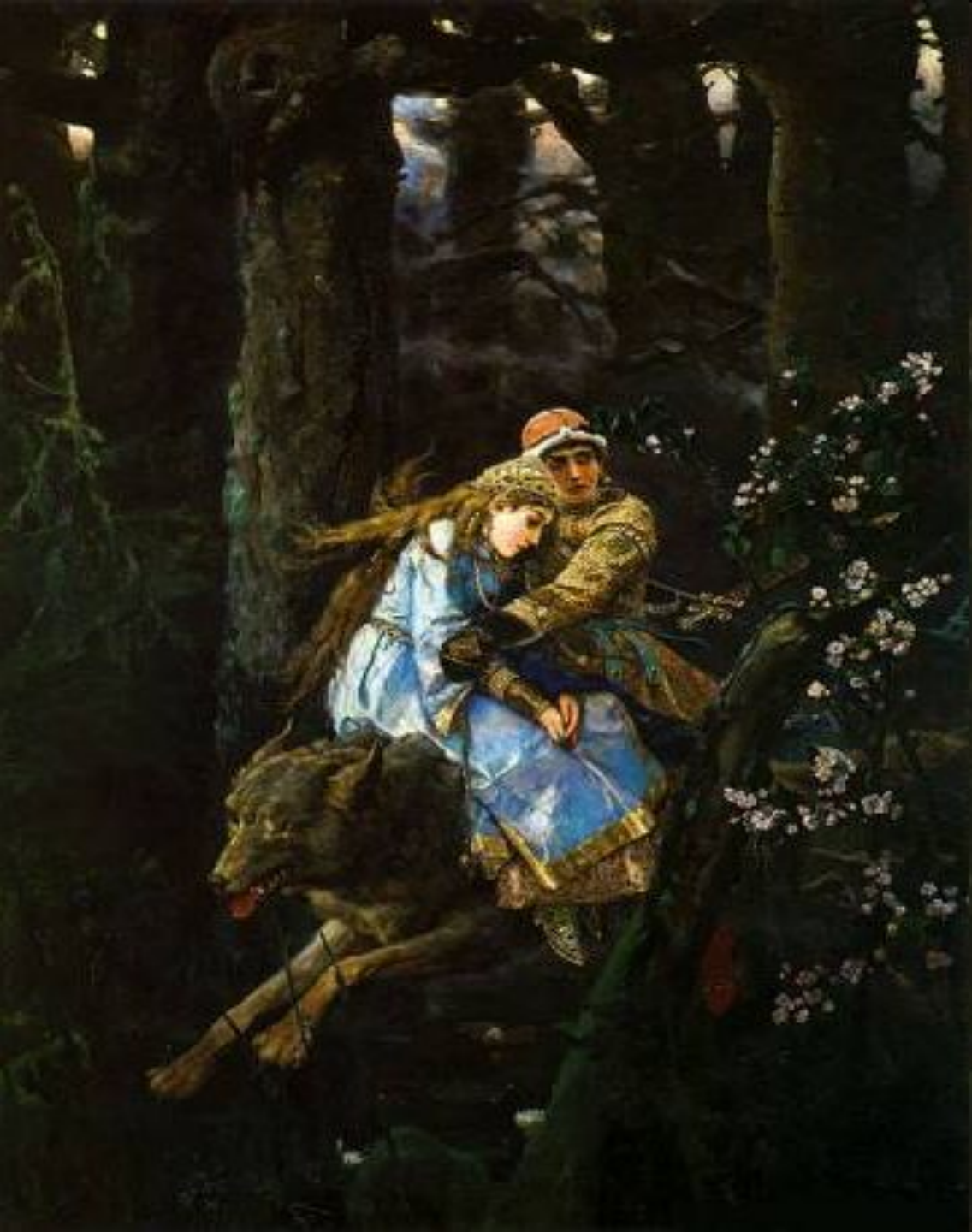
Васнецов «Иван-царевич на сером волке».