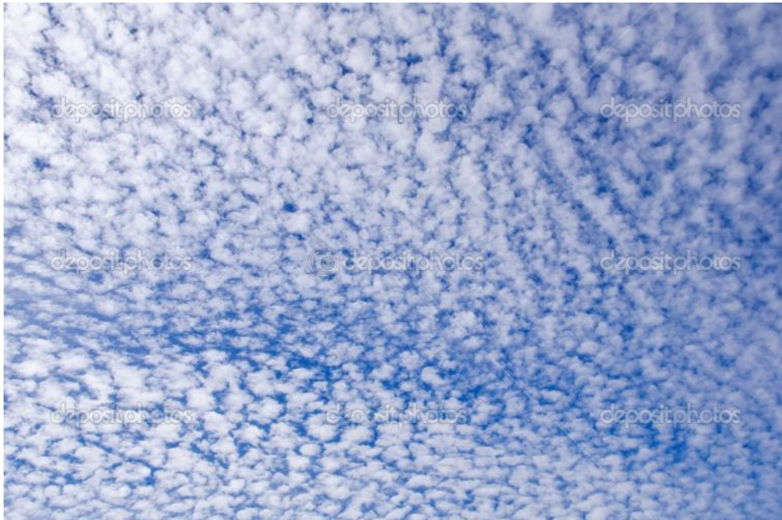
Высоко-кучевые облака (барашки)