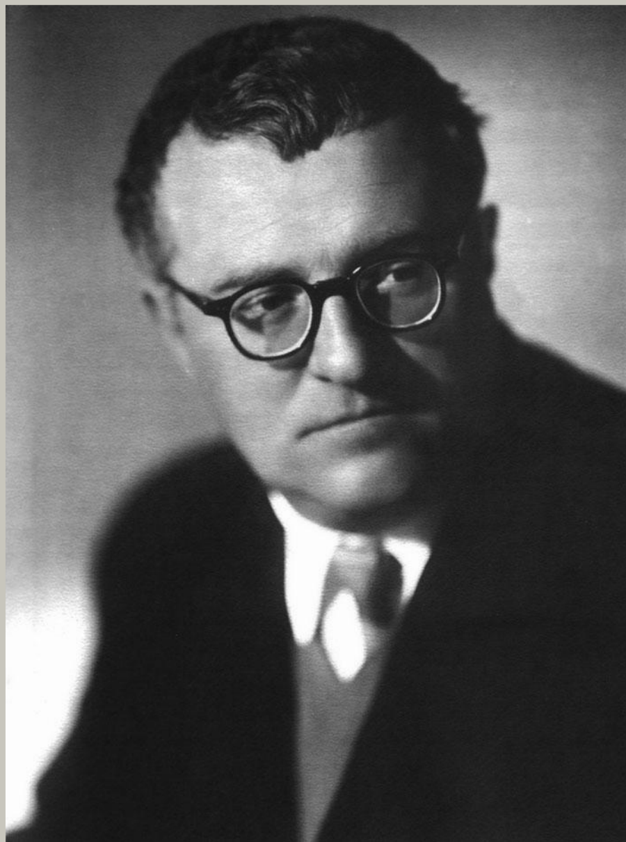
Георгий Васильевич Свиридов