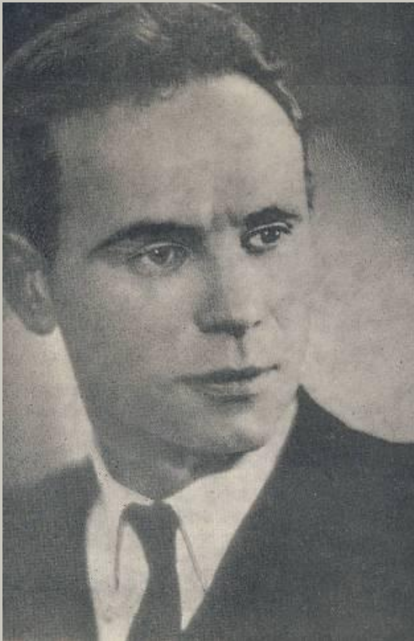
Константин Дмитриевич Воробьев