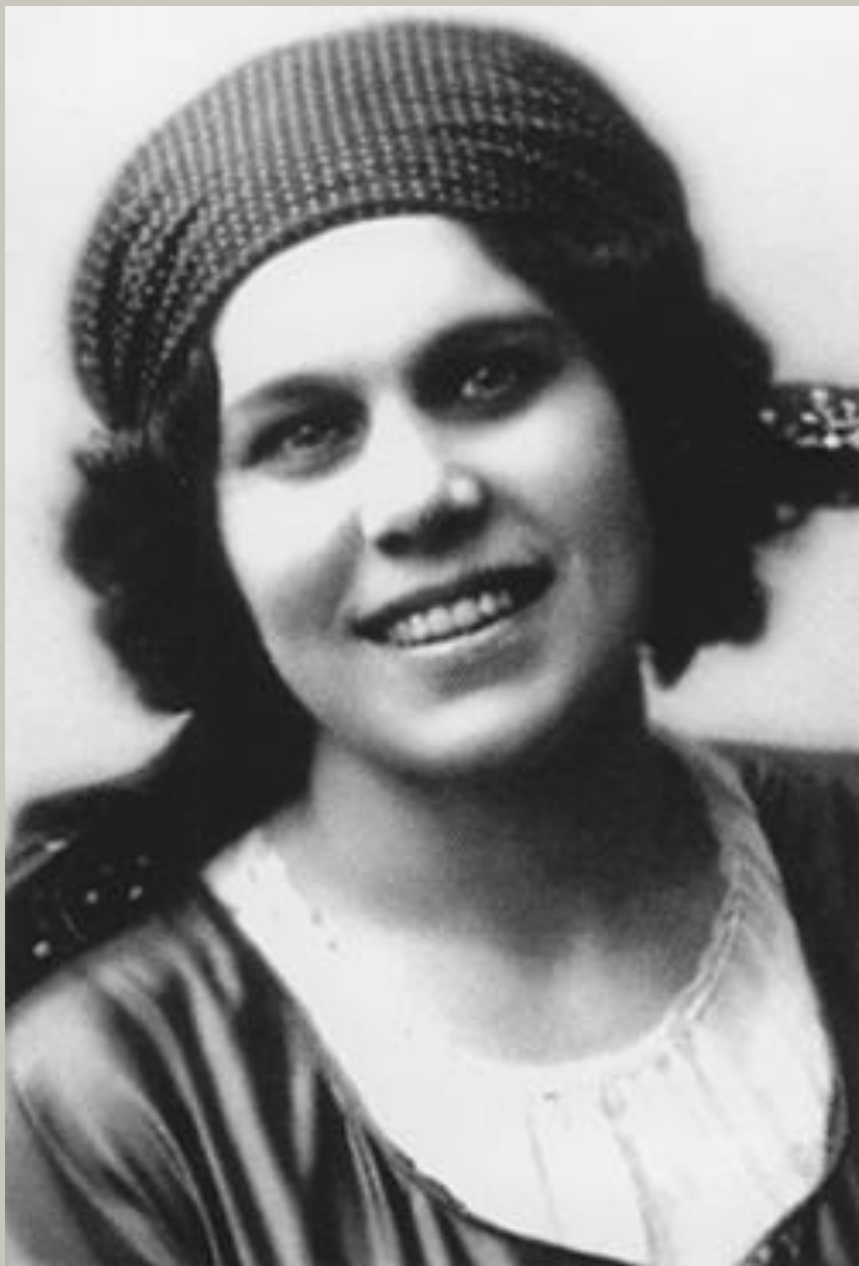
Надежда Васильевна Плевицкая