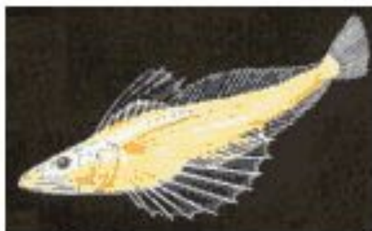
большая голомянка ( Comephorus baicalensis )