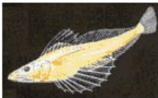
большая голомянка ( Coregonus baicalensis )