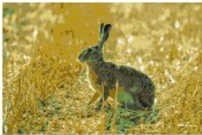
Заяц-русак - Lepus timidus