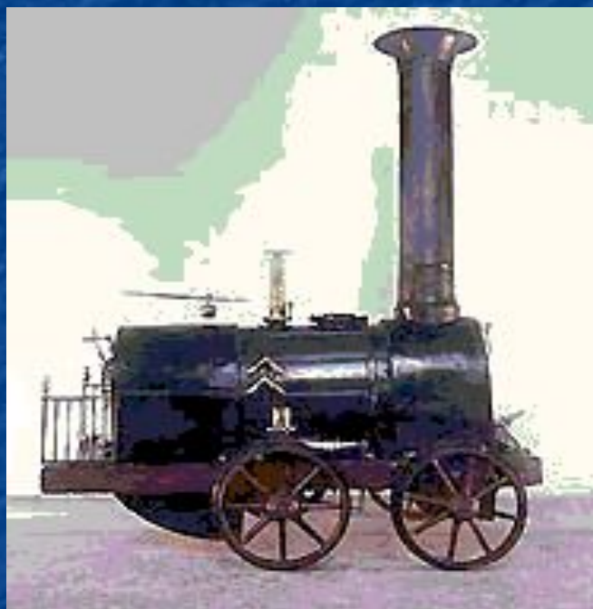
Модель первого российского паровоза (Черепановы)