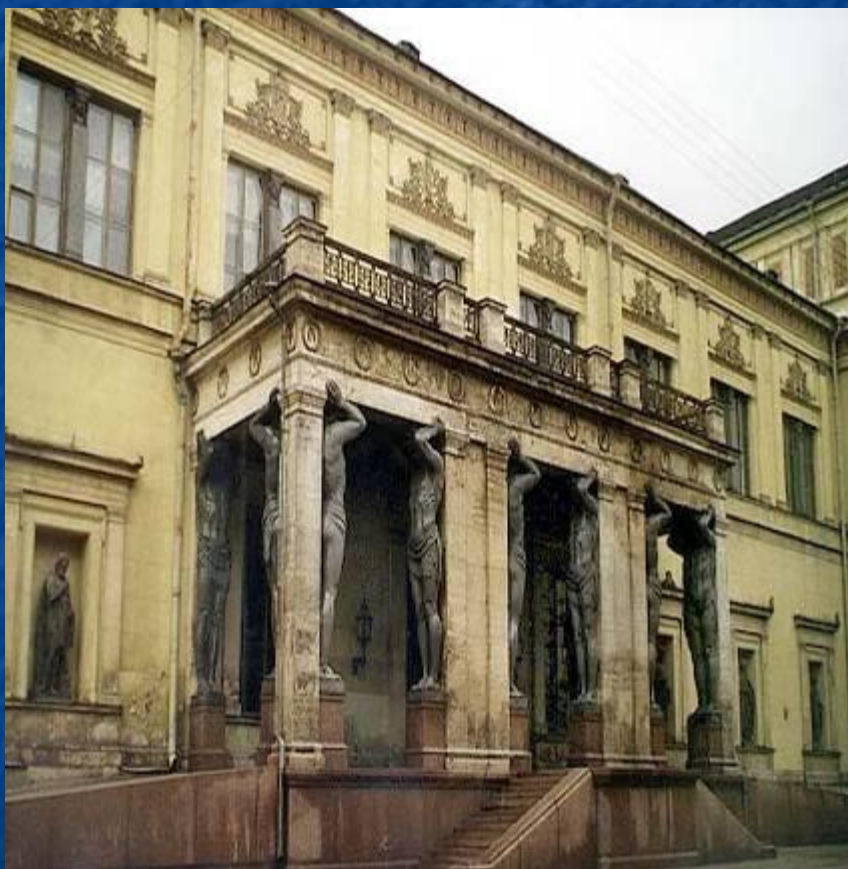
Портик Нового Эрмитажа