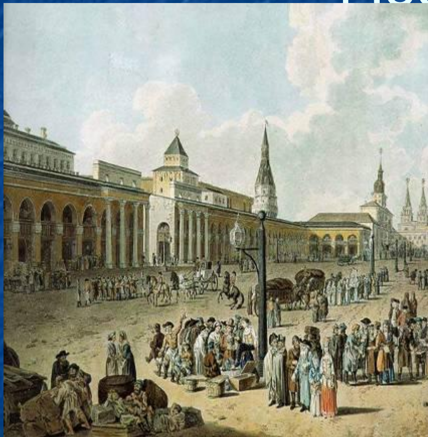
Вид на Красную площадь