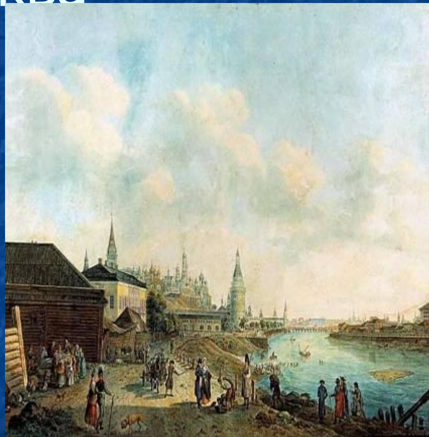
Набережная Москвы-реки. Вид на Кремль