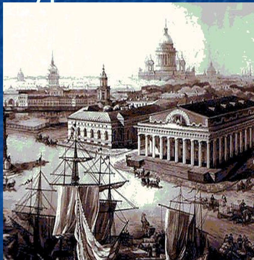
Стрелка Васильевского острова