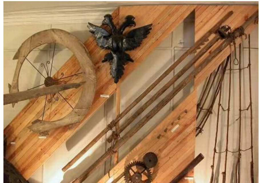
Переславль – Залесский. Корабельные снасти в музее- усадьбе «Ботик Петра I»