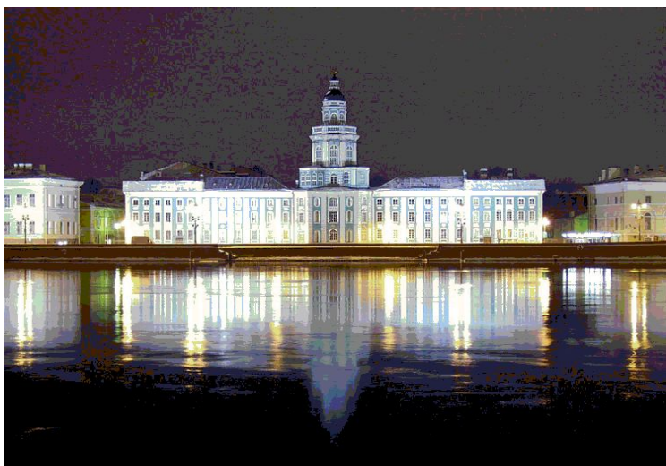
Здание Кунсткамеры. Петербург.