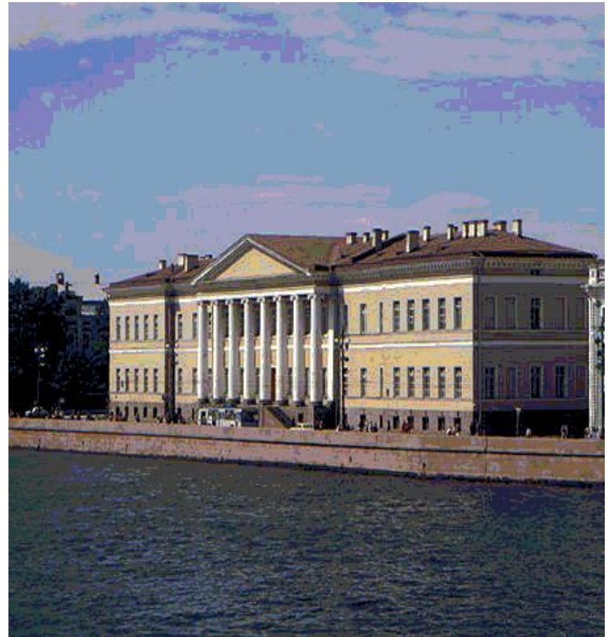
Здание Академии наук в Петербурге