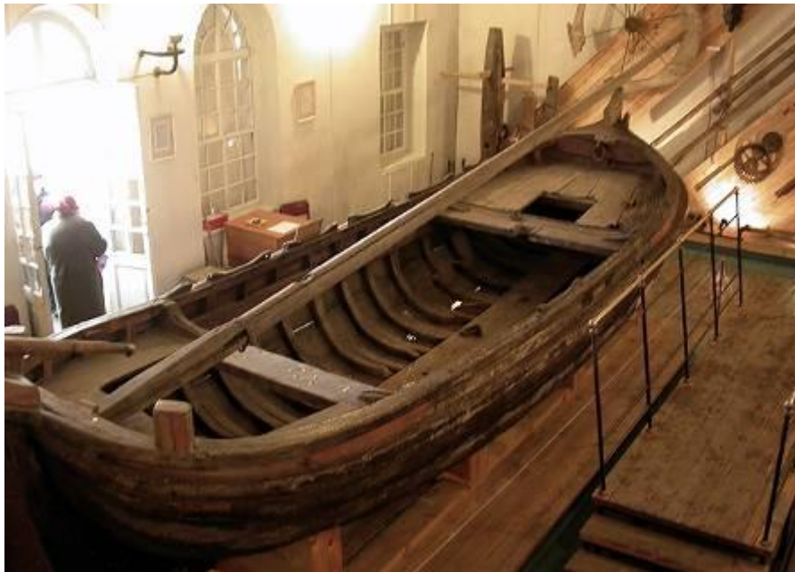
Переславль - Залесский. Бот «Фортуна» в музее-усадьбе «Ботик Петра I»