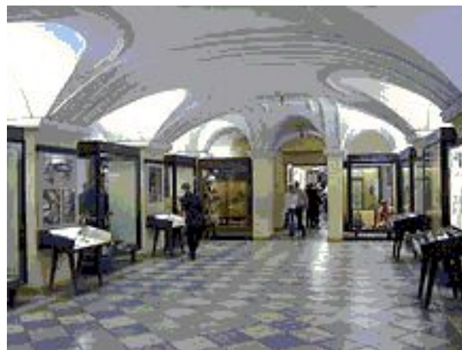
В зале музея. Петербург. Кунсткамера.