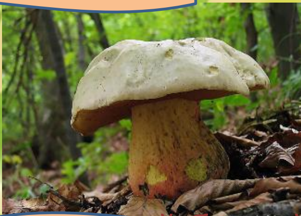
ложный белый гриб