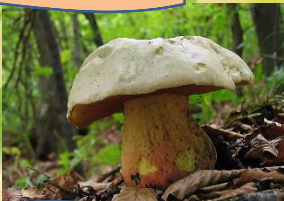
ложный белый гриб