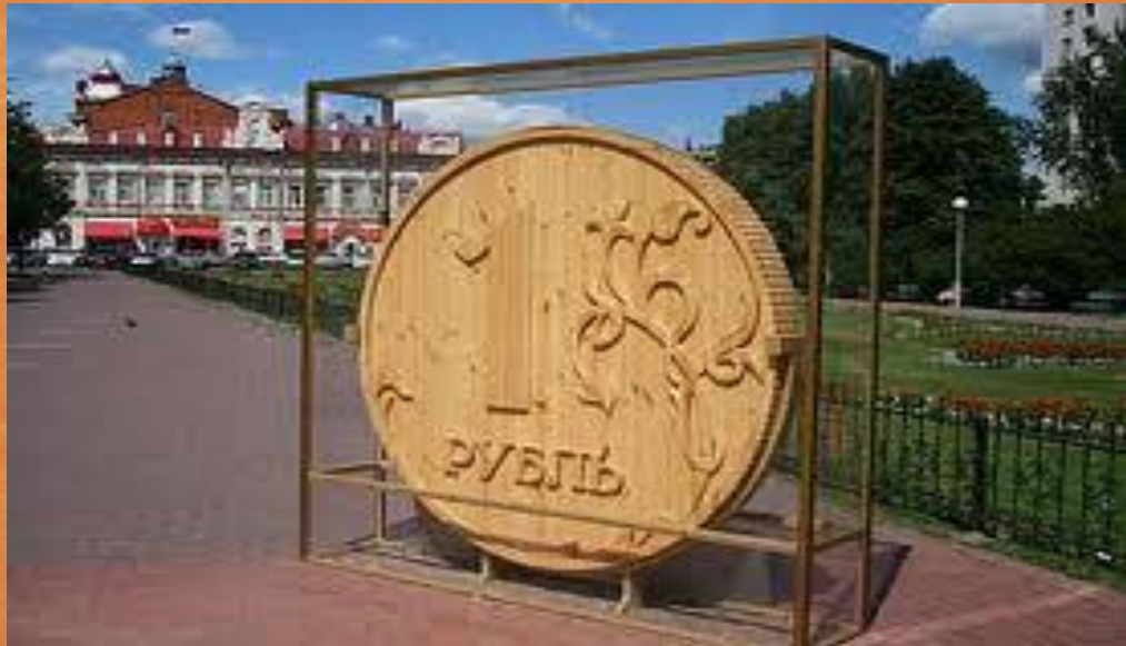
Памятник рублю в г. Томск

Гривну рубили и отсюда возникло слово «рубль».