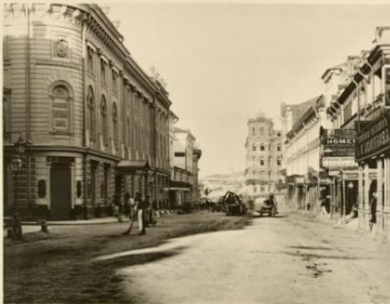
МОСКВА 1767 ВИДЪ ИЛЬЯНКИ

Москва во второй половине XVIII века После окончания эпохи Петра Великого, во время которой силы всех лучших Русских архитекторов были брошены на возведение новой столицы, Петербург, снова взялись за перестройку и строительство Москвы. В это время прямо на глазах вырастали церкви и больницы, школы и университеты, а так же различные общественные здания. В число самых выдающихся архитекторов середины XVIII века, входили М. Казаков и В. Баженов.