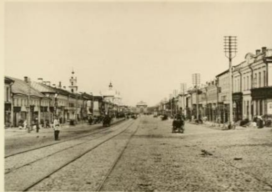
МОСКВА 1767 ВИДЪ ТВЕРСКОЙ-СМСКОЙ