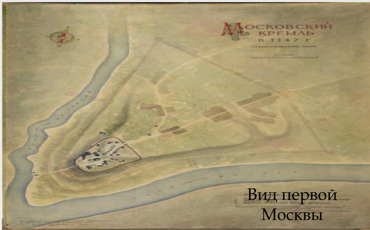
Вид первой Москвы