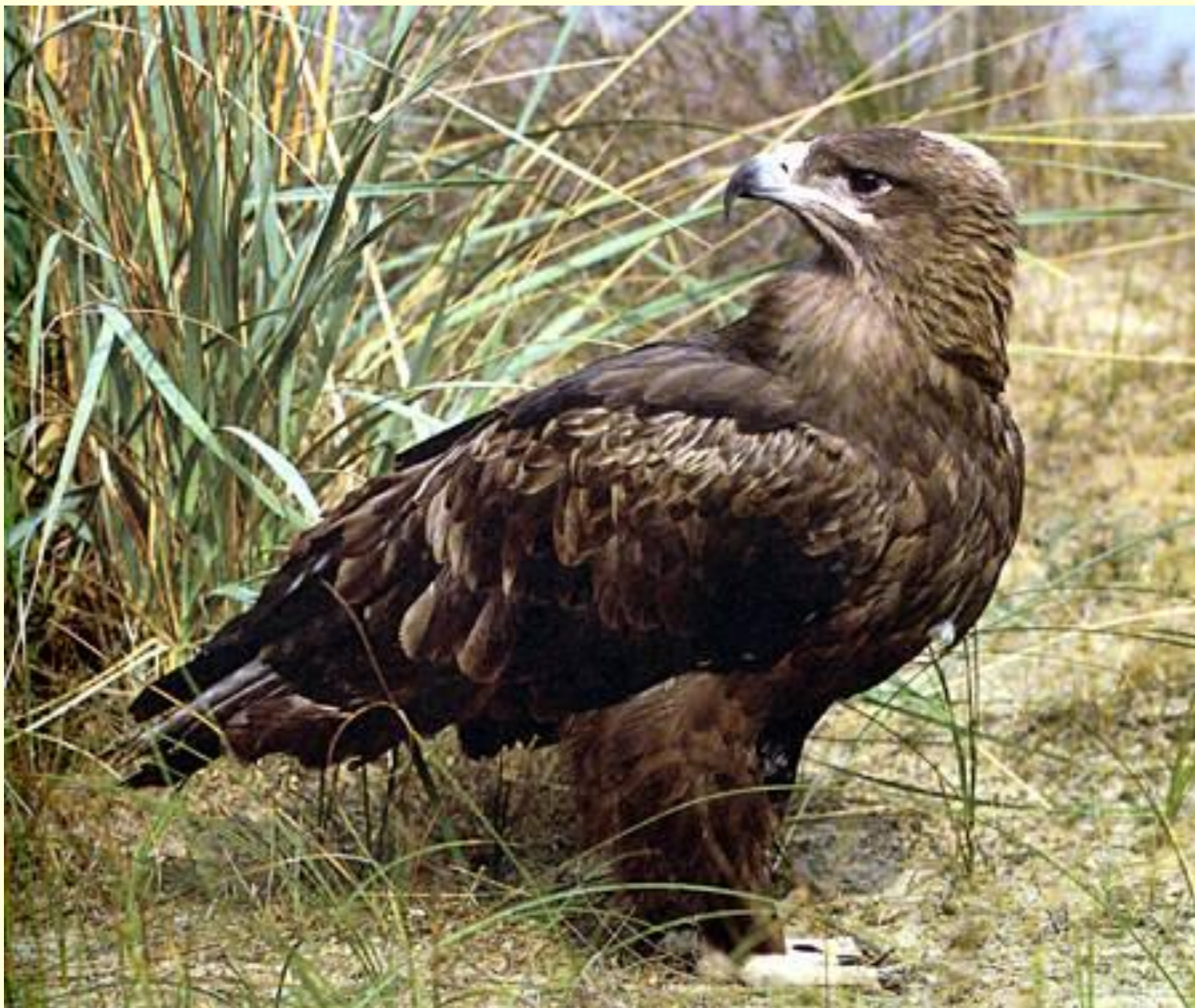
Степной орёл- живой памятник природы