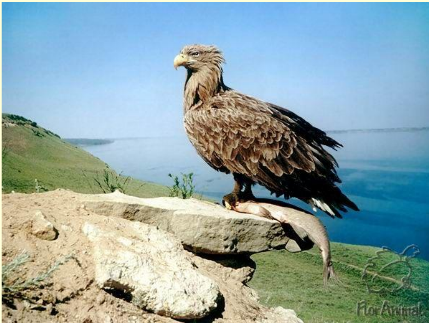
Орлан - белохвост