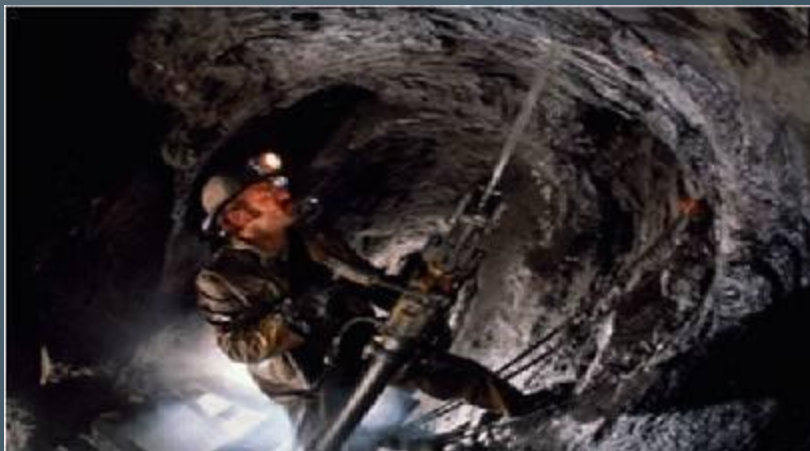
Уголь добывают в шахтах.