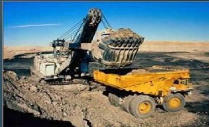
В открытых котлованах-карьерах.

Карьер – это открытый котлован. Шахты – это глубокие колодцы.