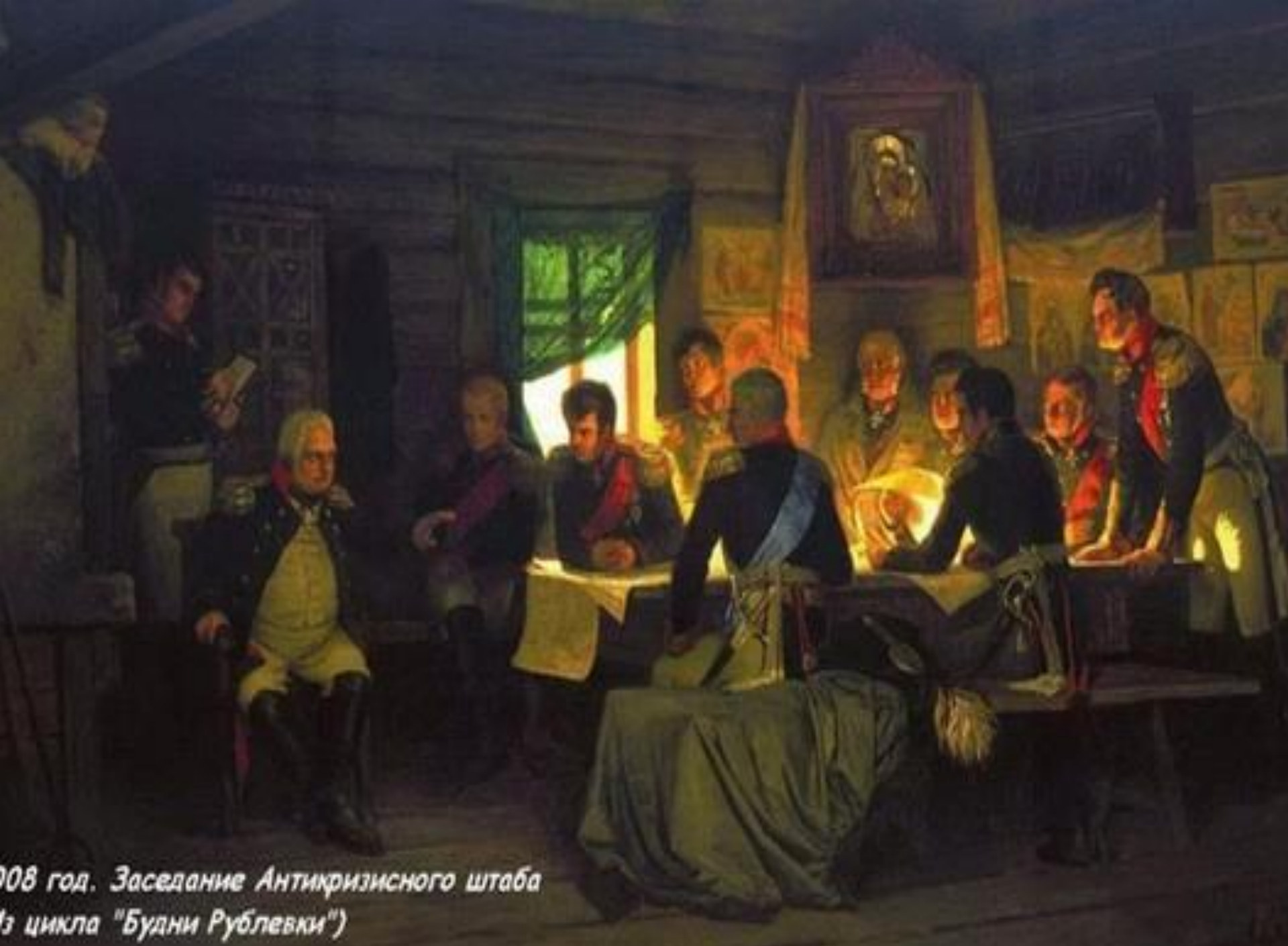
1908 год. Заседание Антикризисного штаба (из цикла "Будни Рублевки")