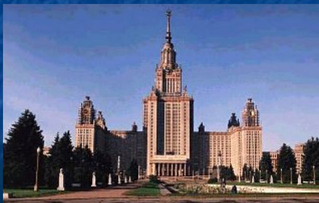
Московский государственный университет имени М.В.Ломоносова