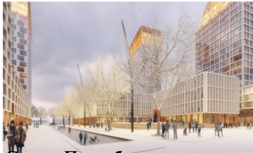
Район «Новое лицо Санкт-Петербурга»