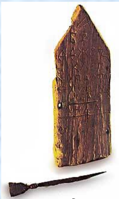
Деревянная дощечка, покрытая воском и писало