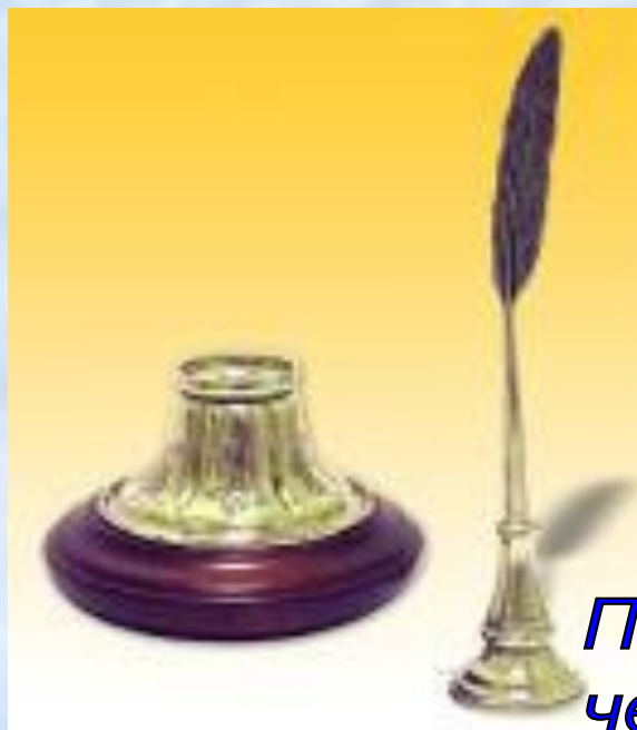
Перо и чернильница