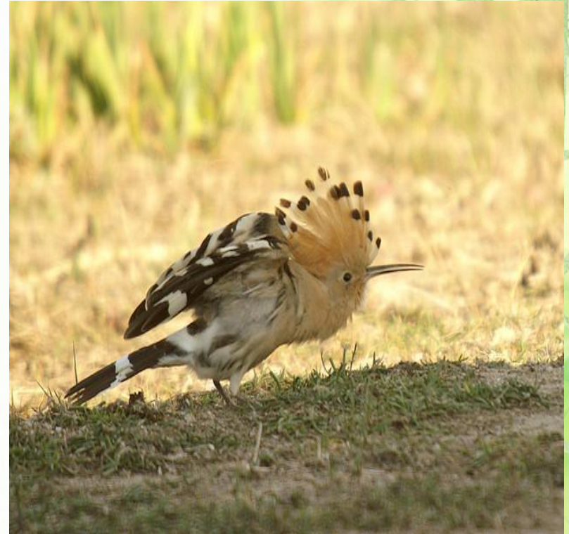
Возмущенный удод.

Характерной особенностью удода является хохолок на темени. Обычно он сложен, но когда эта птица чем-нибудь напугана или нервничает, она распахивает его в виде веера.