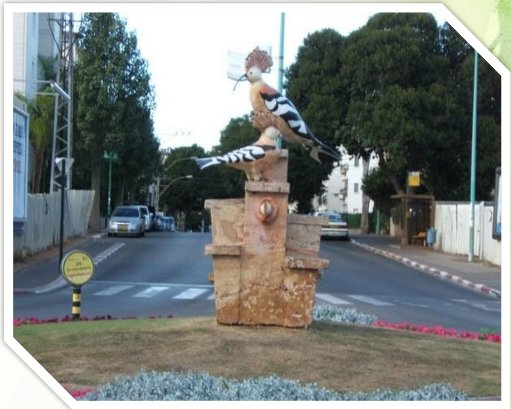
Памятник удо́ду на ул. Ротшильд в Петах Тикве.

В Израиле в результате всенародного голосования в 2008 году удо́д избран национальным символом этой страны.