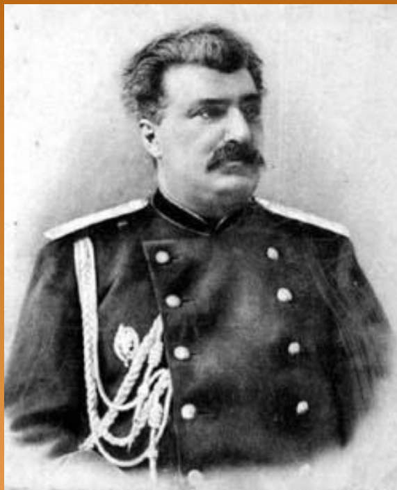
Н. М. Пржвальский.

«Поражает вид ели, обвитой виноградом, или пробковое дерево и грецкий орех, растущие рядом с кедром и пихтой.»