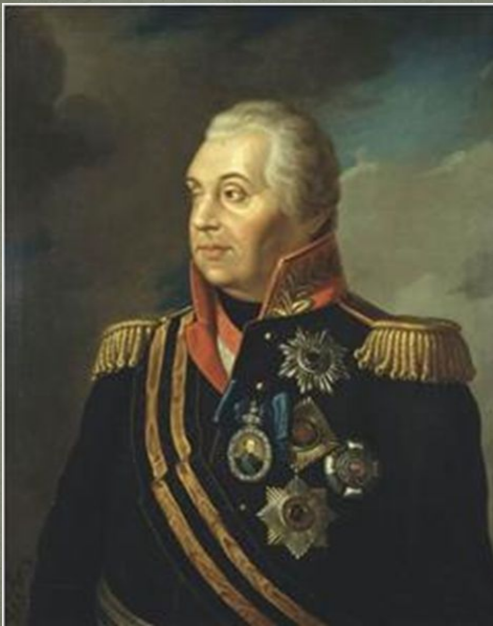
Главнокомандующий русской армии Михаил Илларионович Кутузов