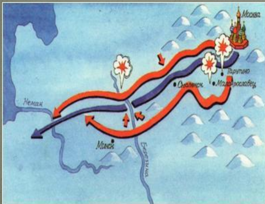
Схема отступления французской армии по смоленской дороге. Остатки наполеоновского войска.