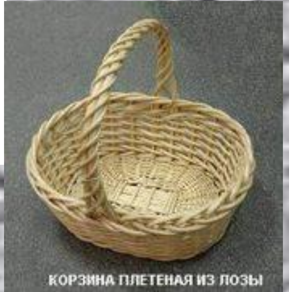
КОРЗИНА ПЛЕТЕНАЯ ИЗ ЛОЗЫ