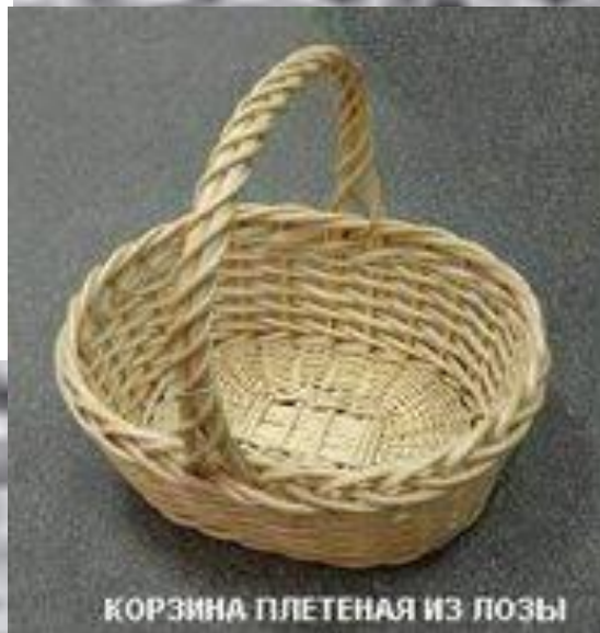
КОРЗИНА ПЛЕТЕНАЯ ИЗ ЛОЗЫ