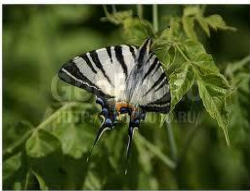
8 kurd001017 Hvaličkijski National Park, Sarajevo Region, Bosnia Kogan Dmitrij (C) Geophoto.ru