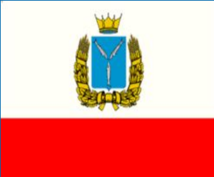
Флаг Саратовской области