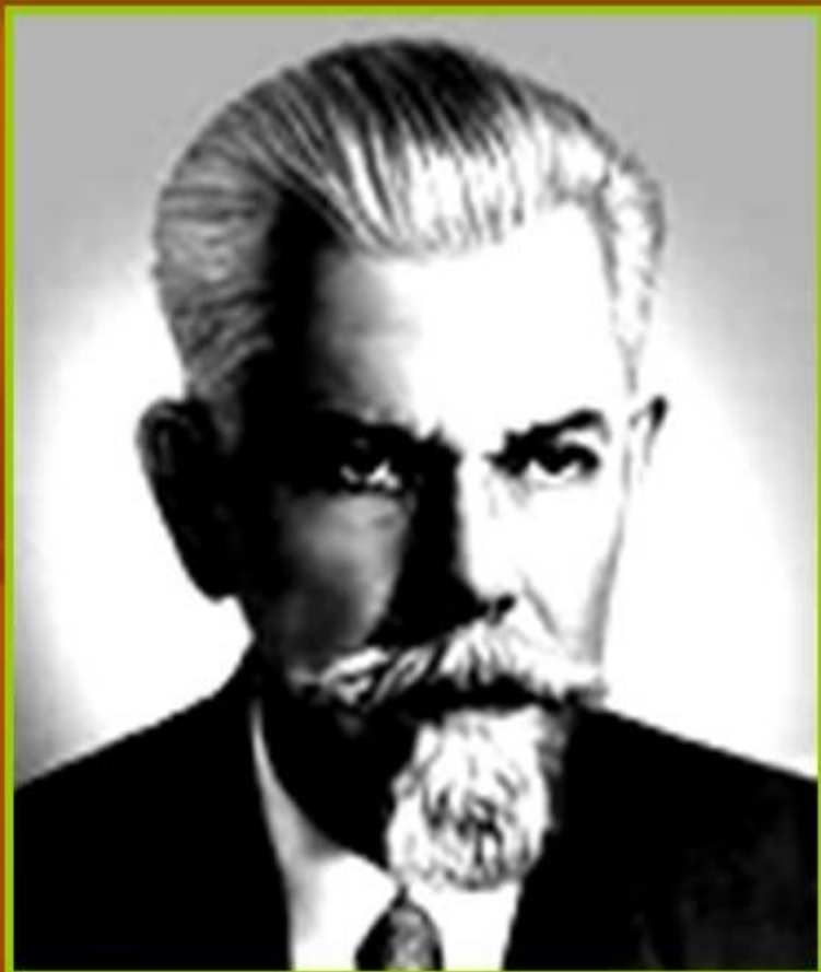
С.И.Ожегов (1900 – 1964)