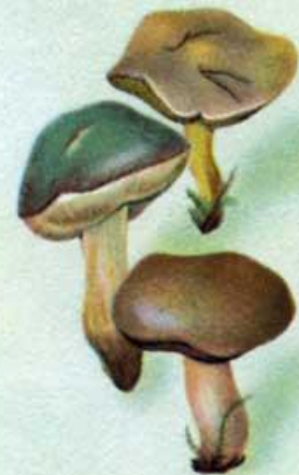
Моховик и козляк