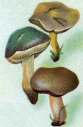
Моховик и козляк