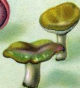
Сыроежка зеленая, желтая, красная