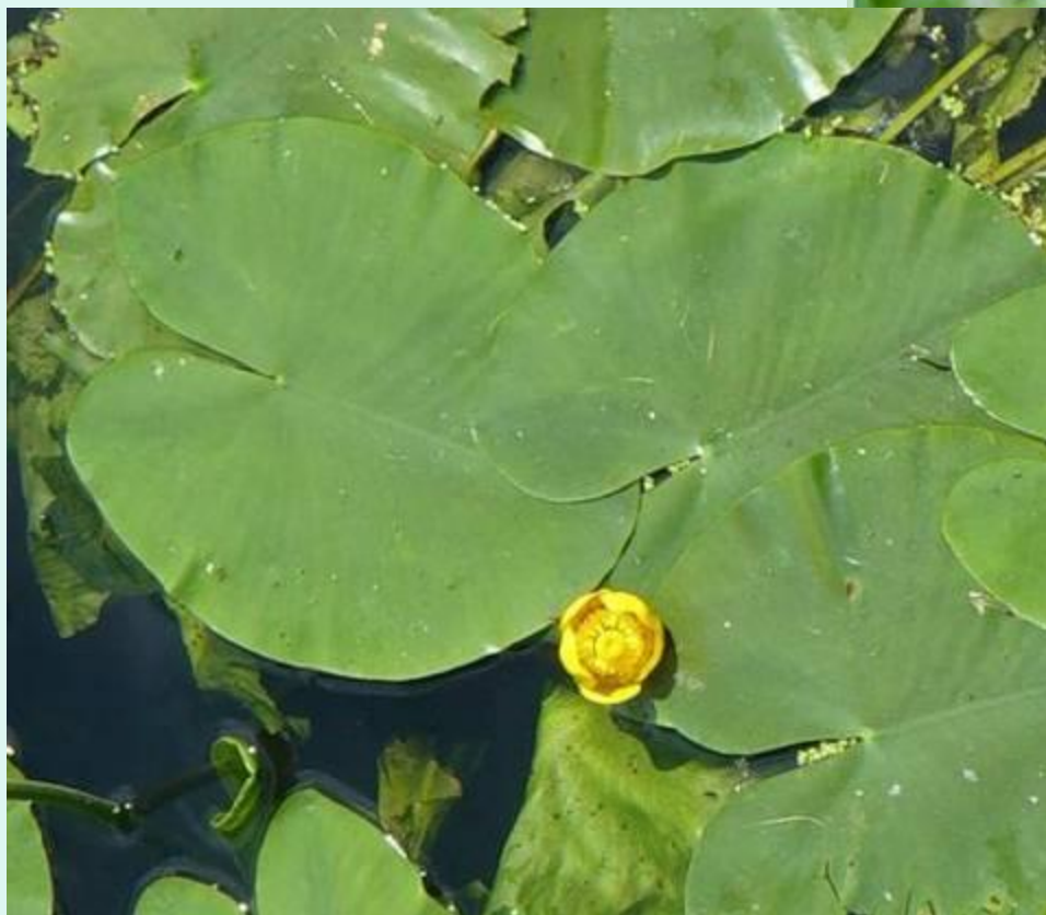
Кубышка (жёлтая кувшинка)