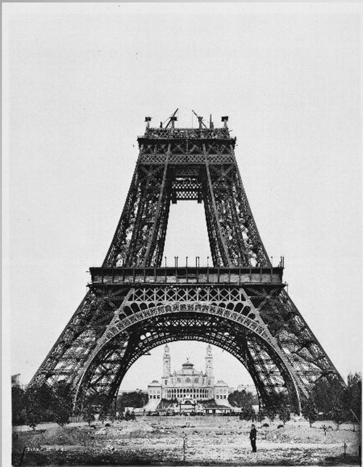
View of the tower