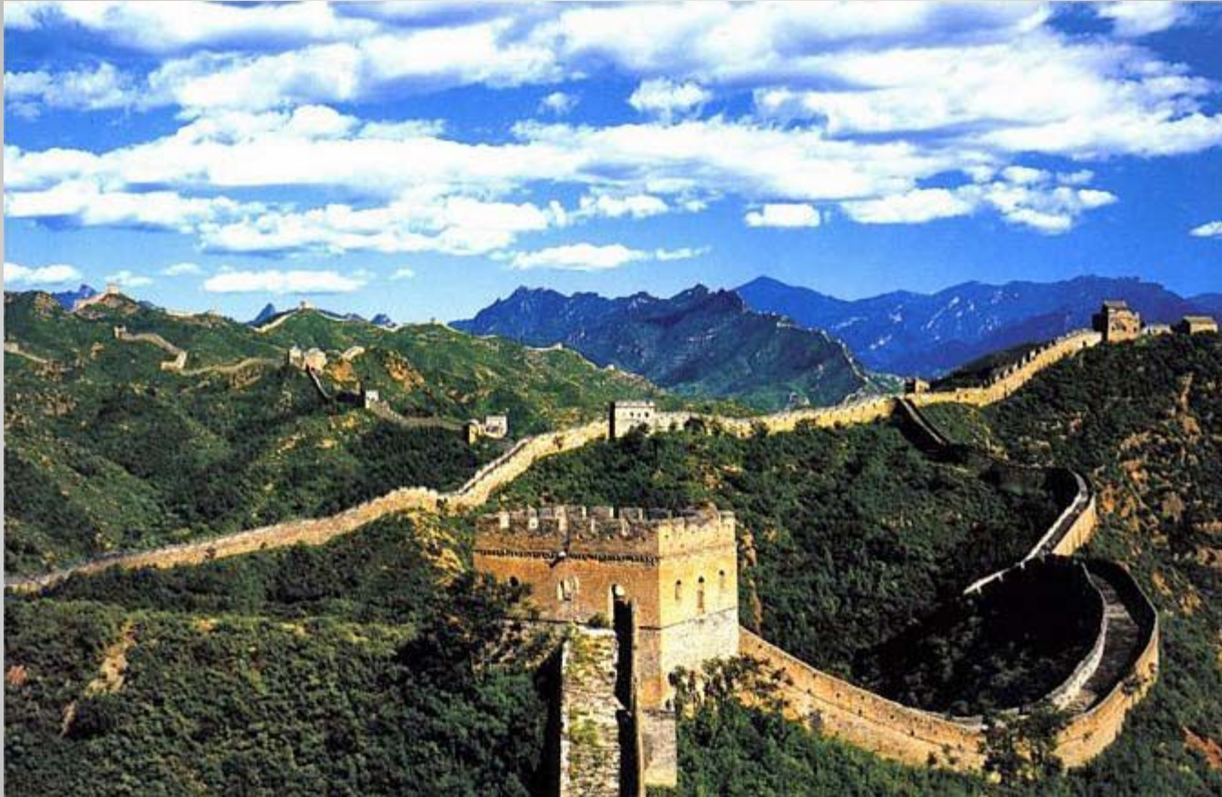
Великая Китайская стена