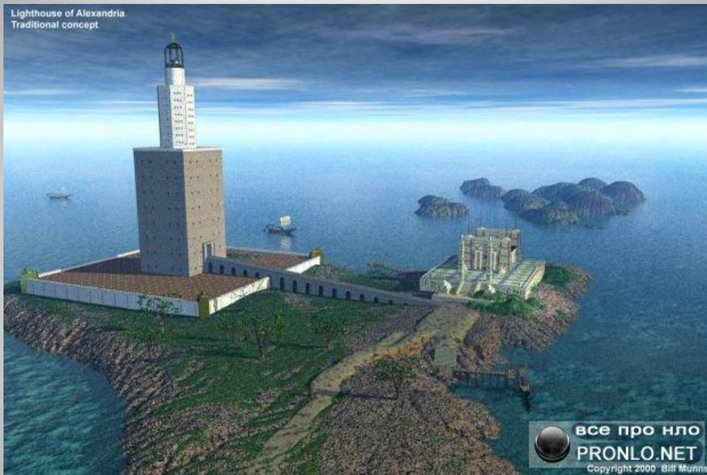
Lighthouse of Alexandria Traditional concept