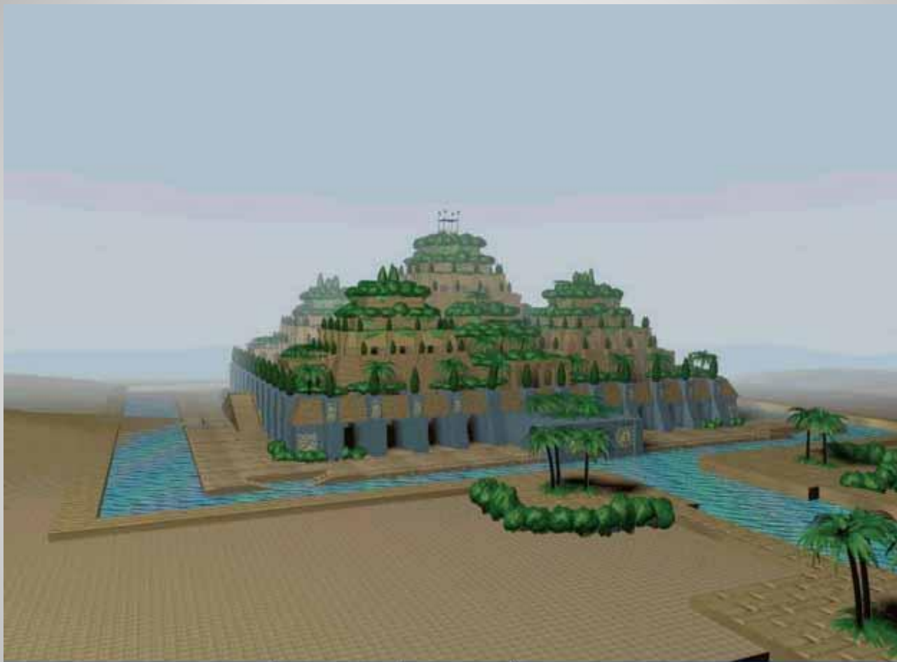
Висячие сады Семирамиды. Реконструкция.