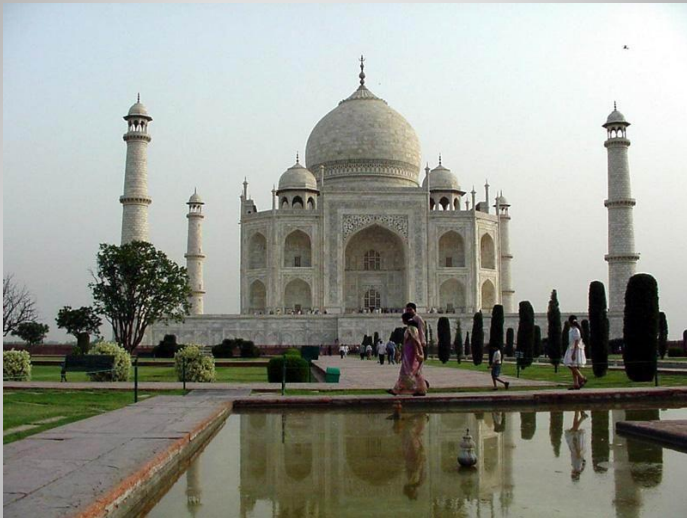
Мавзолей Тадж- Махал в Индии