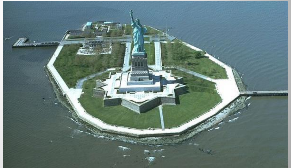
Статуя Свободы в США