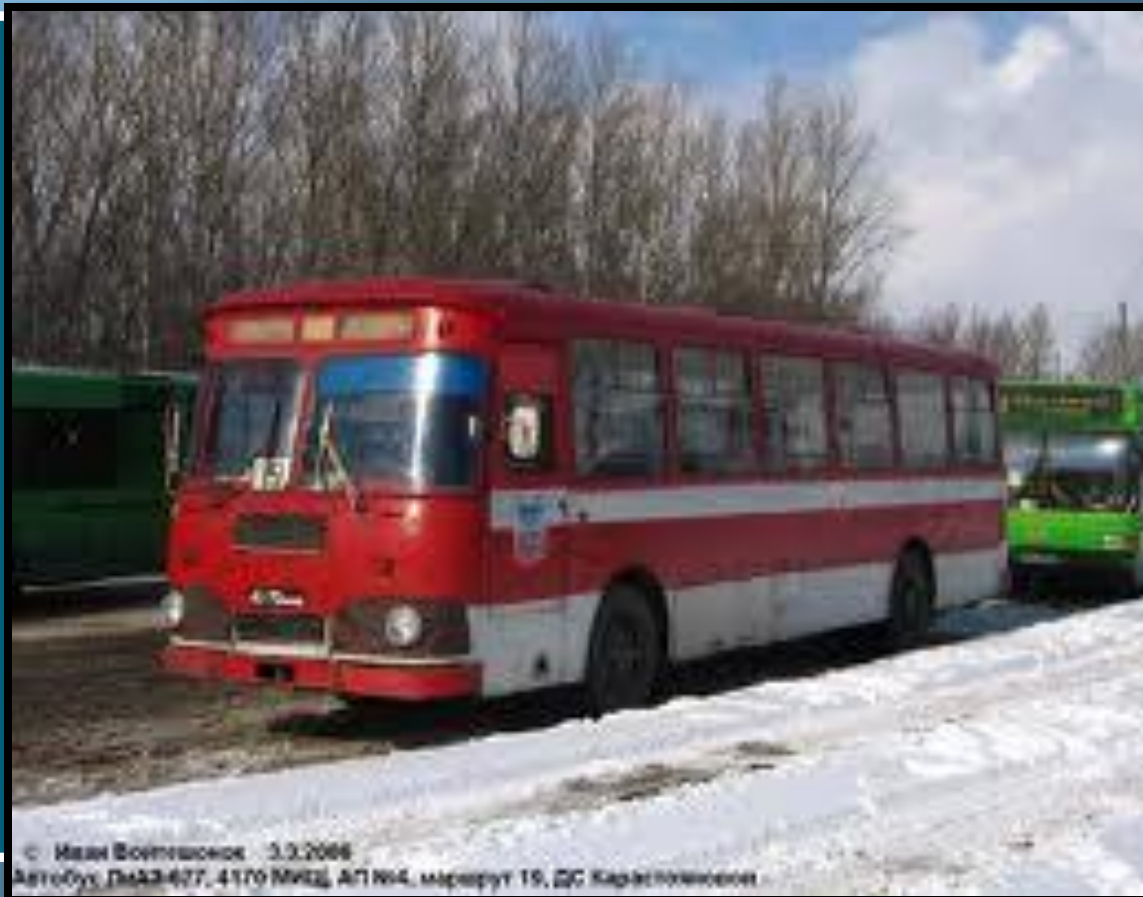
3.3.2006 Автобус ЛиАЗ-677, 4170 ММЗ, АП №4, маршрут 19, ДС Барнаулэнерго