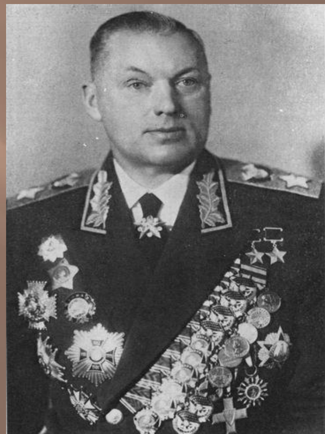
Рокоссовский Константин Константинович