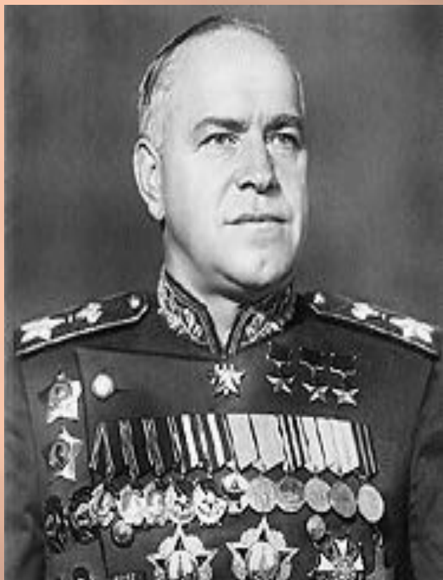
Жуков Георгий Константинович