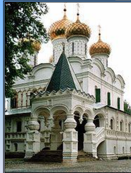
Ипатьевский монастырь. Троицкий собор.