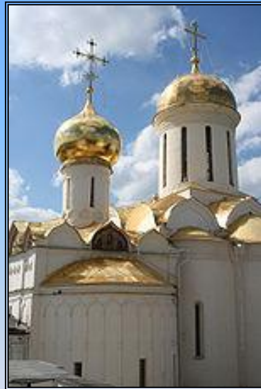
Троицкий собор Троице-Сергиевой лавры