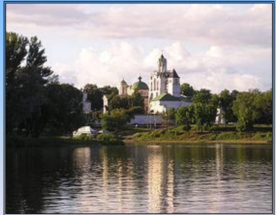
Спасо – Преображенский монастырь