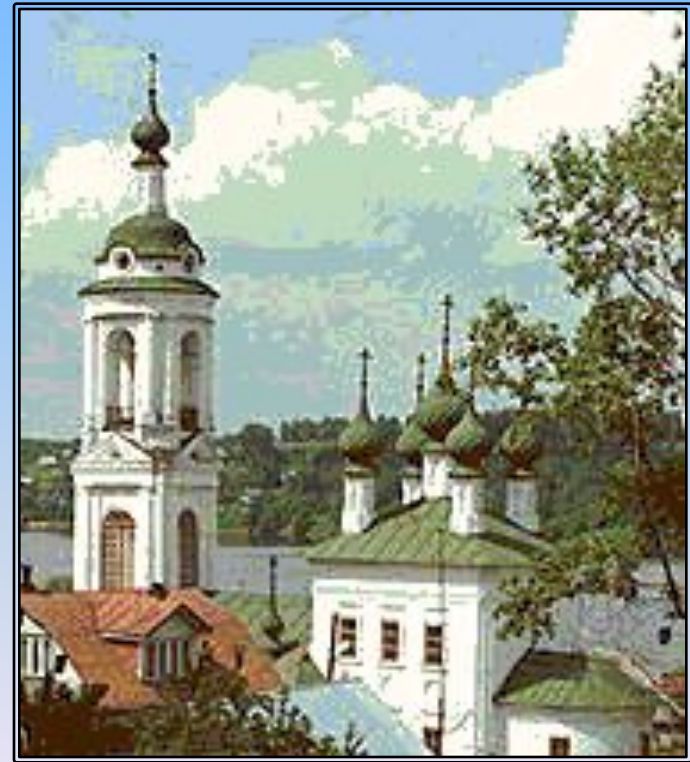
Церковь Варвары Великомученицы