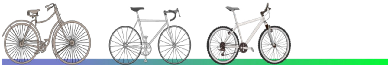
1885 безопасный велосипед Джон Кемп Старли Англия