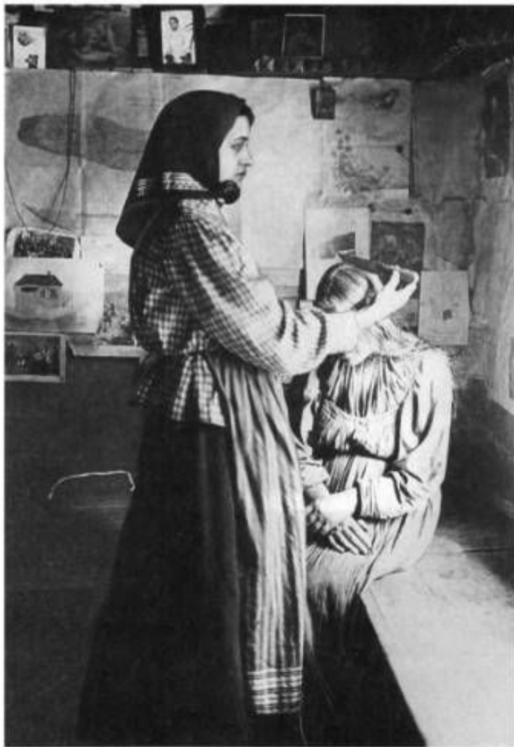
Лечение знахаркой больной припадками женщины при помощи ножа и молитвы. Рязанская губерния. 1914 г.

ии всей истории , составляли ья. Главное в обья – не только состав о также время варки и ив, кореньев, о деревенский лекарь- зрачеват