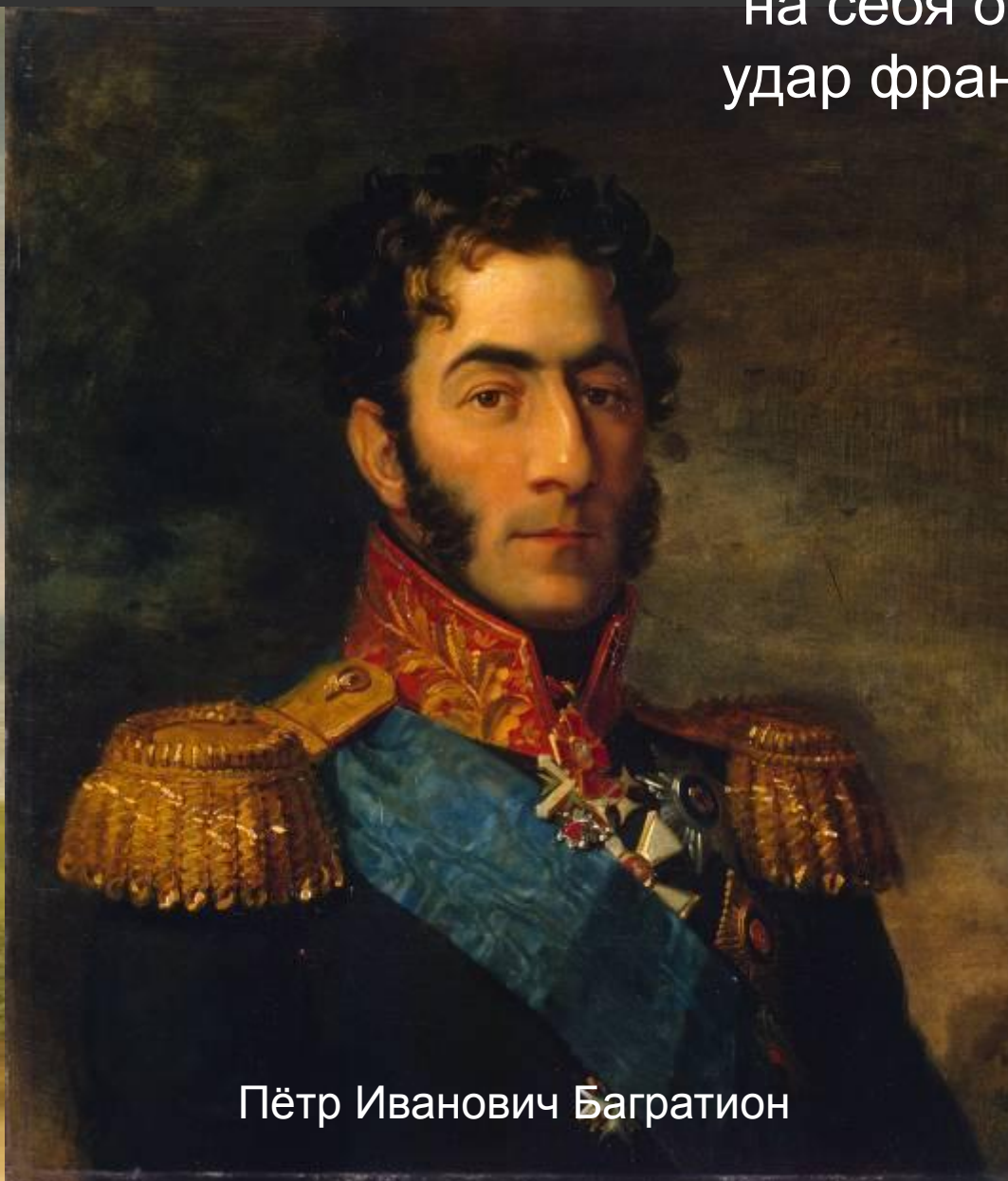
Пётр Иванович Багратион