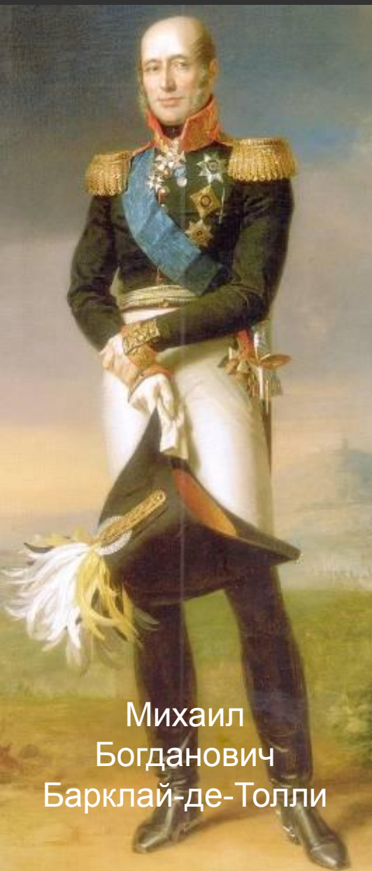
Михаил Богданович Барклай-де-Толли

Их армии приняли на себя основной удар французской армии