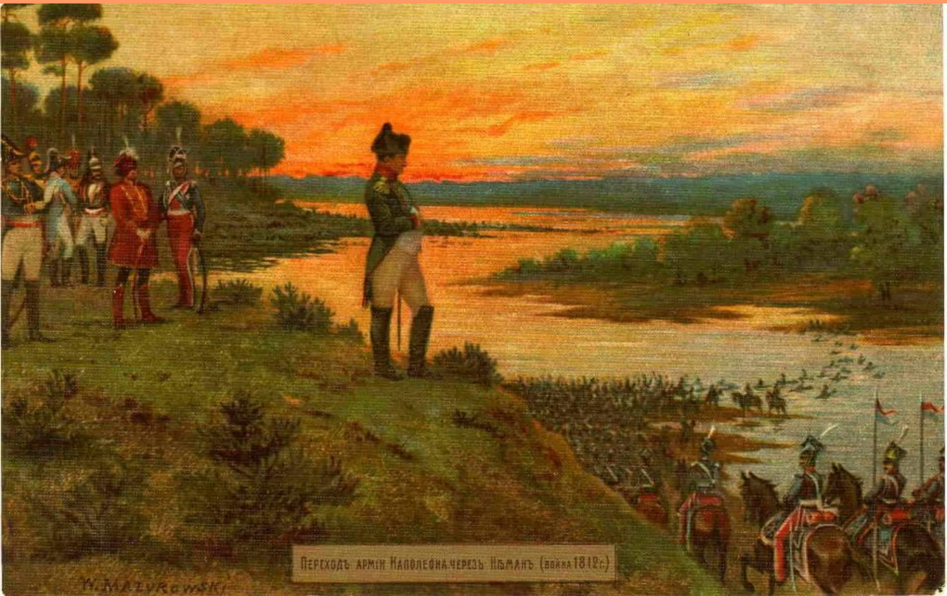
Переходъ арміи Наполеона черезъ Неманъ (война 1812г.)

12 июня 1812 года Наполеон с Великой Армией пересек границу, переправившись через реку Неман.