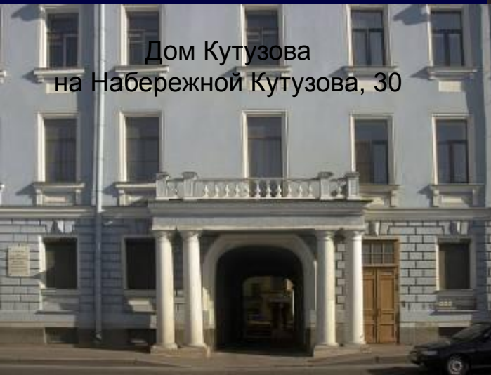
Дом Кутузова на Набережной Кутузова, 30

Александр I понял, что его воинских знаний не достаточно, чтобы одолеть Наполеона. Он уехал в Санкт-Петербург, а главнокомандующим назначил известного русского полководца фельдмаршала Кутузова.