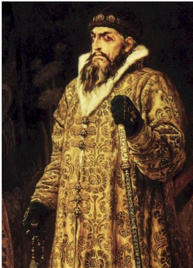
С.М.Васнецов «Иван Грозный»