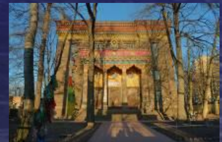
Буддийский храм в Санкт-Петербурге