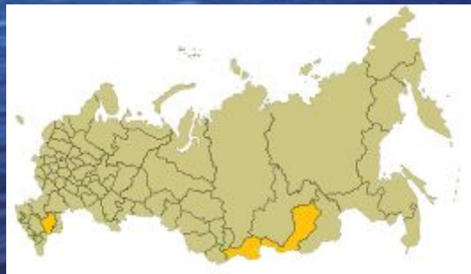
Районы в России с мусульманским большинством. ислам