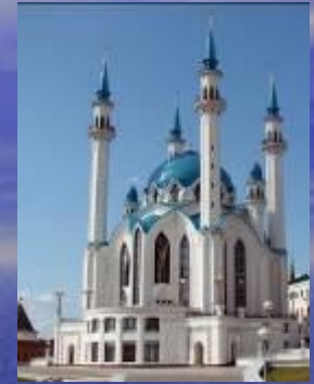
Мечеть Кул Шариф, Казань