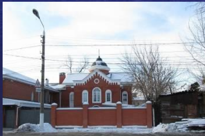
Синагога в Туле

Также в городе находится синагога и еврейский общинный дом.