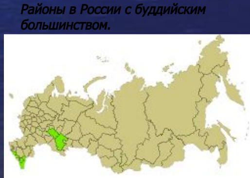
Районы в России с буддийским большинством.