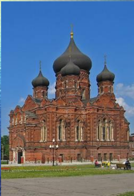
Успенский собор Тульского Кремля

Все православные организации Тулы и Тульской области входят в Тульскую и Белевскую епархию.