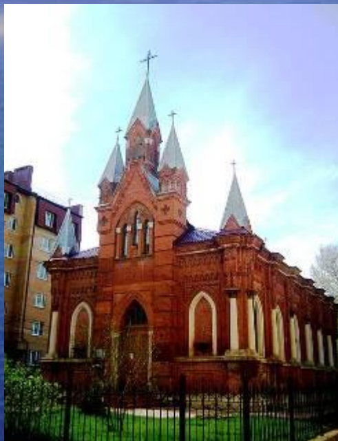
Католический Храм Святых Апостолов Петра и Павла

В Туле находится единственный католический храм области — Святых Апостолов Петра и Павла.