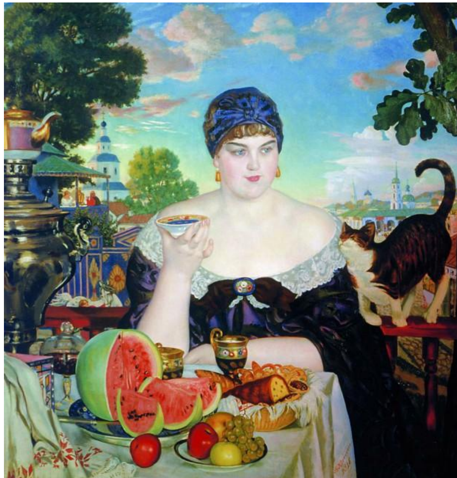
Б.М. Кустодиев Купчиха за чаем