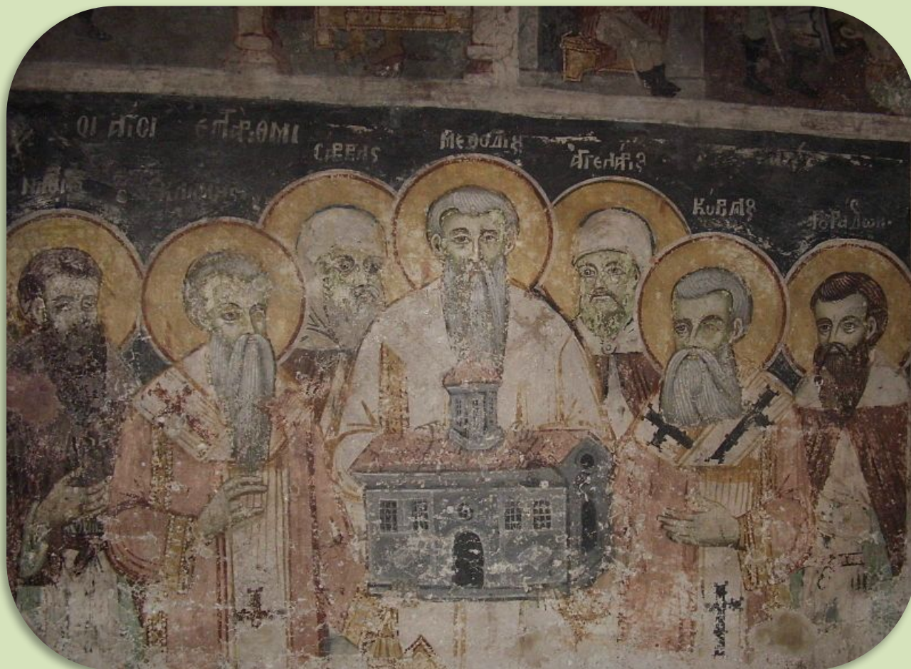
Фреска монастыря «Святой Наум»(в Республике Македонии).

Константин Преславский, Горазд Охридский Климент Охридский, Савва Охридский Наум Охридский, Ангелярий Охридский Лаврентий.