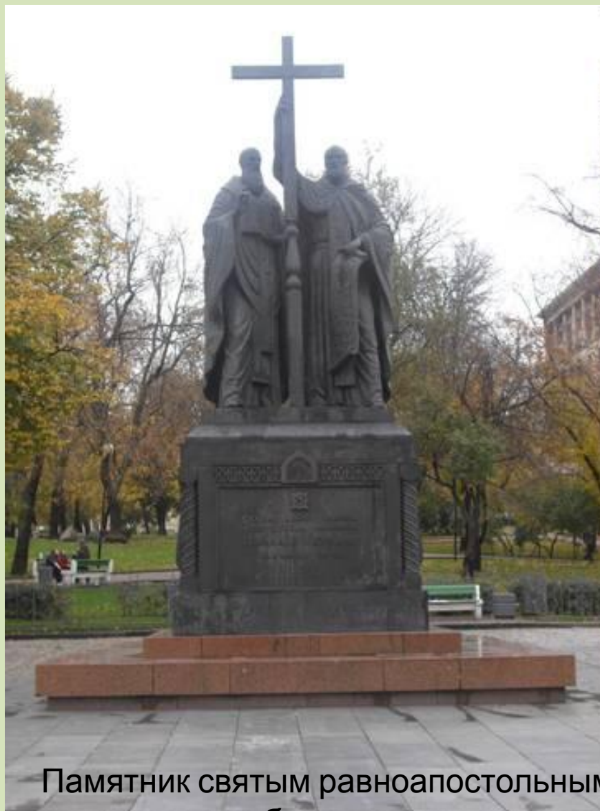
Памятник святым равноапостольным братьям