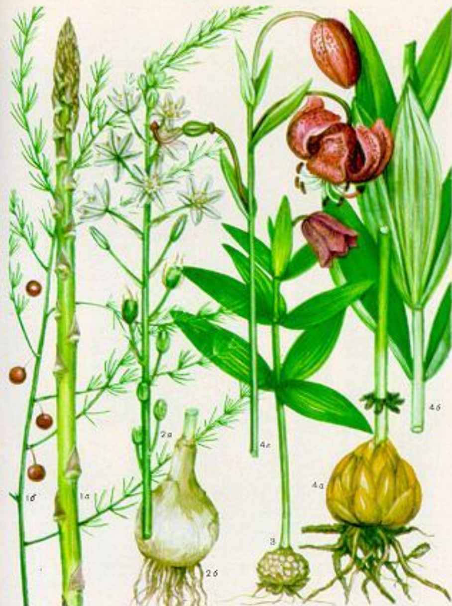
1 — спаржа ленинградская [а — молодой побег, б — побег с плодами] [стр. 67], 2 — пinguicula vulgaris [а — соцветие, б — луковица] [стр. 65], 3 — рorippa nasturtium-aquaticum [а — луковица, б — средняя часть побега, в — верхняя часть побега] [стр. 63]