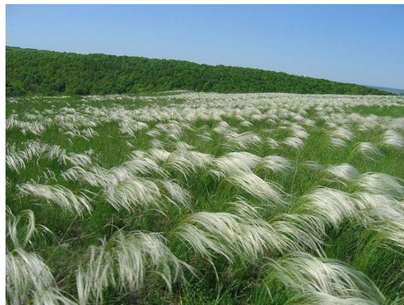
КОВЫЛЬ В СТЕПИ