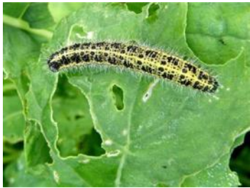
гусеница на капустном листе