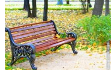
скамейка в парке