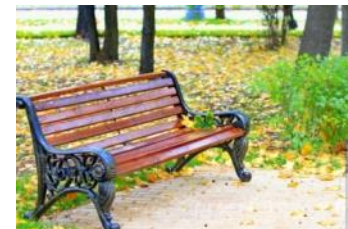
скамейка в парке