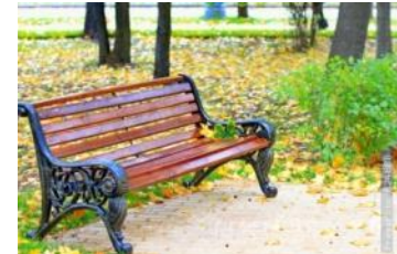
скамейка в парке