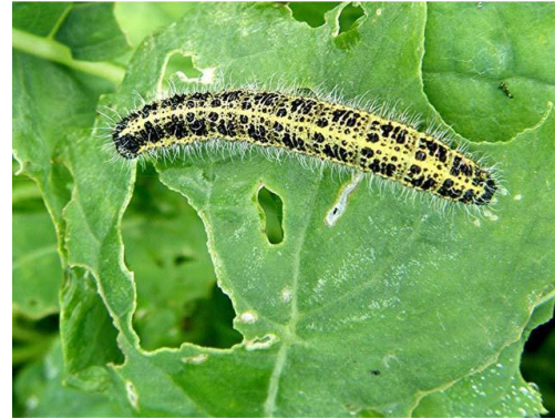
гусеница на капустном листке