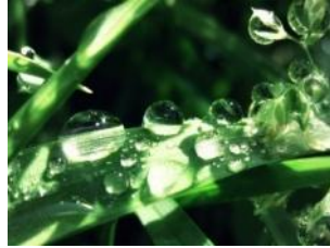
капли росы на траве