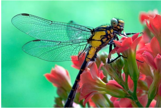
стрекоза на цветке