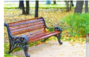
скамейка в парке