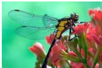
стрекоза на цветке