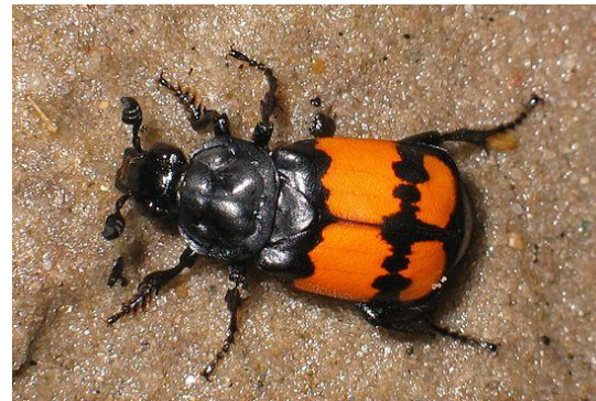
жуки - могольщики