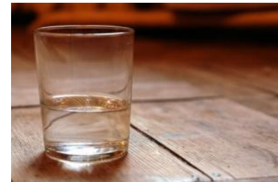
стакан на столе