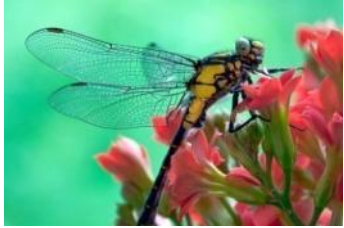
стрекоза на цветке