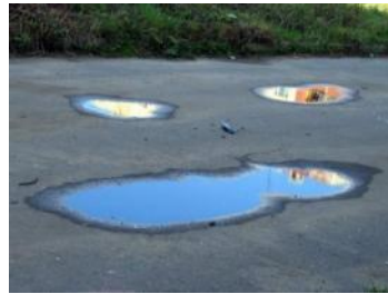
лужа на асфальте