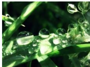
капли росы на траве