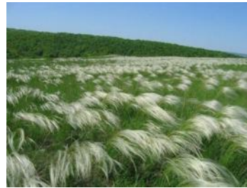
ковыль в степи