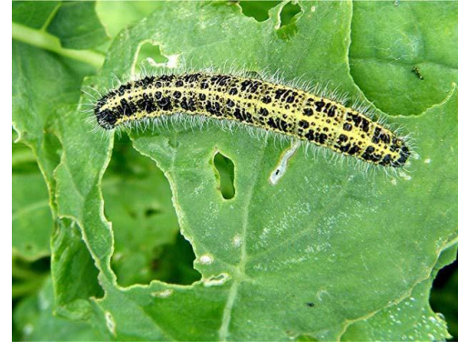
гусеница на капустном листке