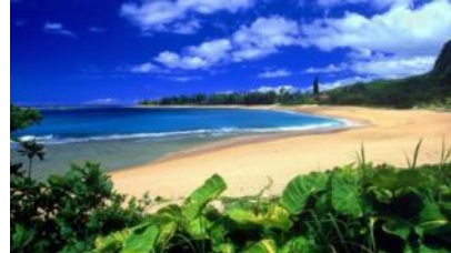
песок на берегу моря