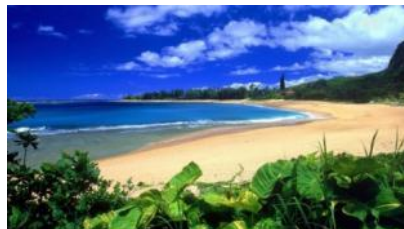
песок на берегу моря