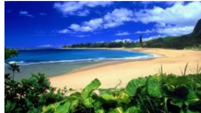
песок на берегу моря