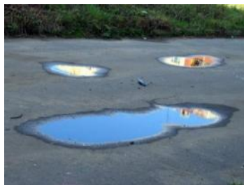
лужа на асфальте