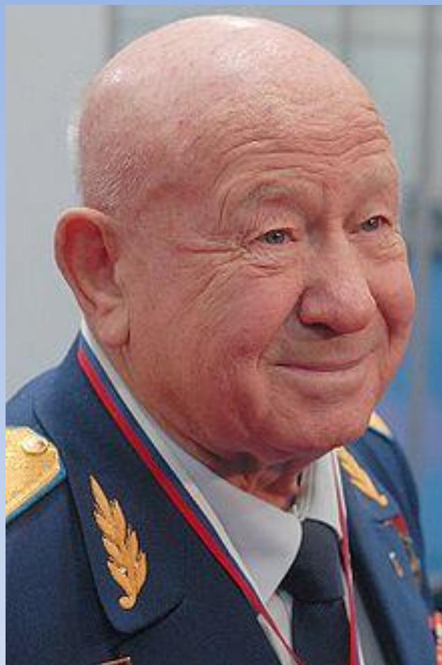
Алексей Архипович Леонов, летчик – космонавт СССР, Дважды Герой Советского Союза