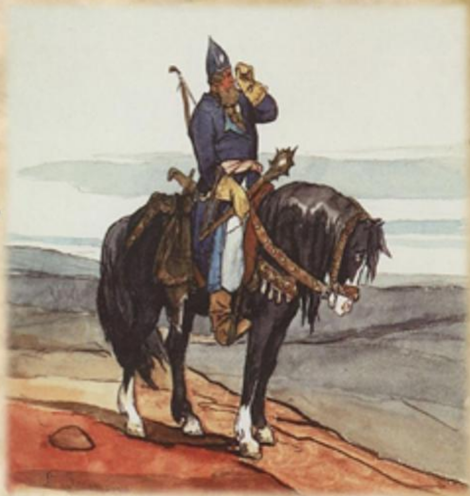
Виктор Васнецов «Богатырь» 1878.